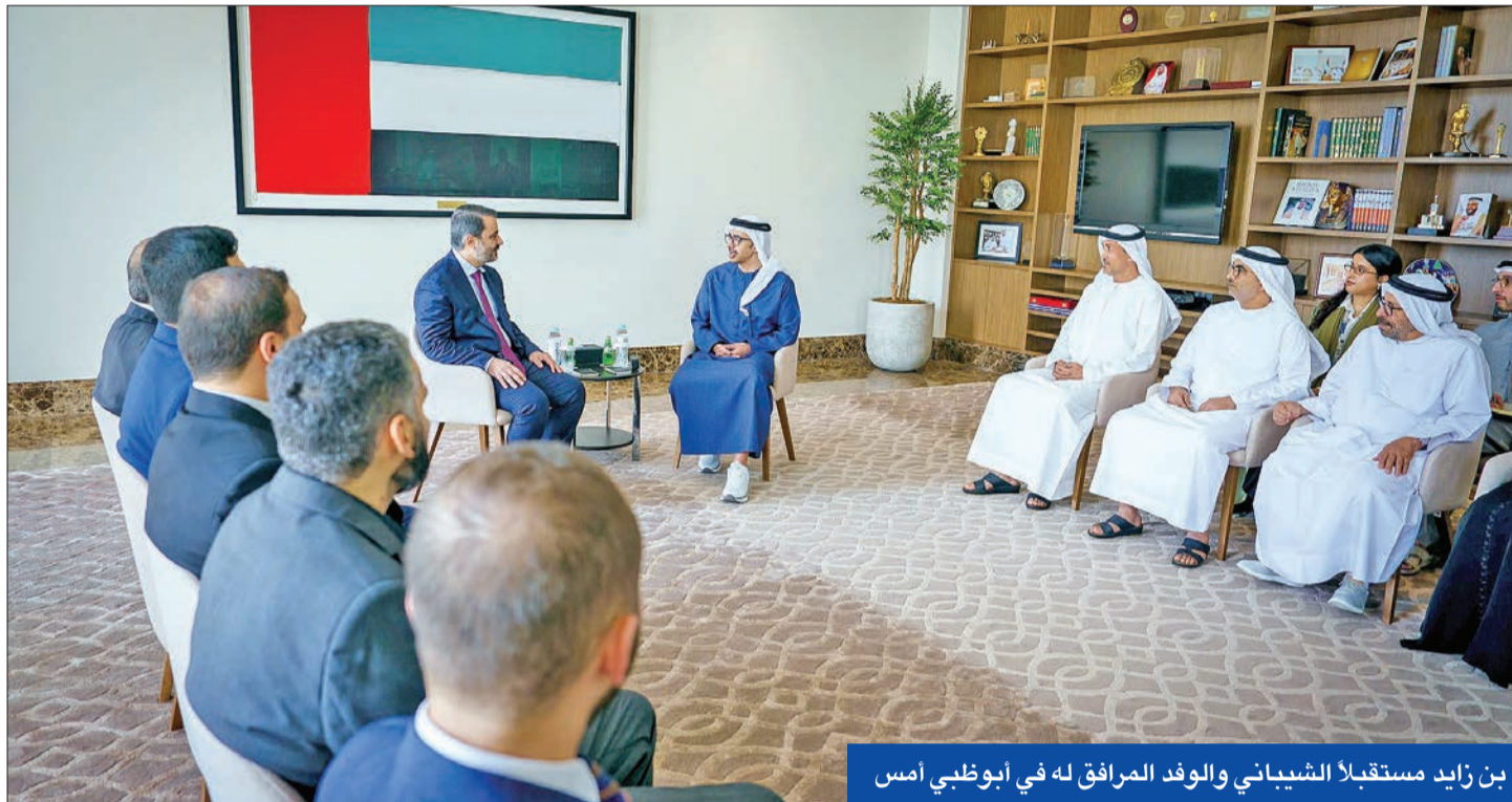
بن زايد مستقبلاً الشيباني والوفد المرافق له في أبوظبي أمس

وجوده ومكانه في سورية ولا تريد حدوث اقتتال في سورية». وتابع: «نقف مع السوريين من أجل ضمان مستقبل يضمنون فيه كل حقوقهم وتوفير مستلزمات حياتهم اليومية».