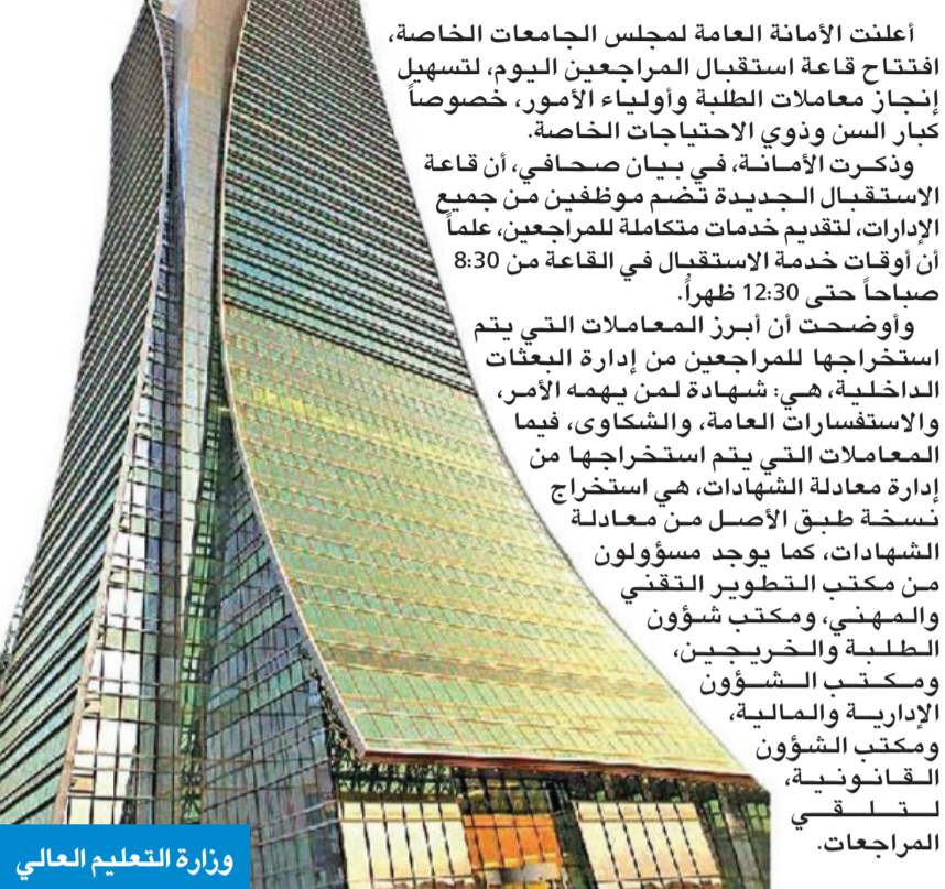
وزارة التعليم العالي

أعلنت الأمانة العامة لمجلس الجامعات الخاصة، افتتاح قاعة استقبال المراجعين اليوم، لتسهيل إنجاز معاملات الطلبة وأولياء الأمور، خصوصاً كبار السن وذوي الاحتياجات الخاصة. وذكرت الأمانة، في بيان صحفي، أن قاعة الاستقبال الجديدة تضم موظفين من جميع الإدارات، لتقديم خدمات متكاملة للمراجعين، علماً أن أوقات خدمة الاستقبال في القاعة من 8:30 صباحاً حتى 12:30 ظهراً. وأوضحت أن أبرز المعاملات التي يتم استخراجها للمراجعين من إدارة البعثات الداخلية، هي: شهادة لمن يهيمه الأمر، والمهني، ومكتب شؤون الطلبة والخريجين، ومكتب الشؤون الإدارية والمالية، ومكتب الشؤون القانونية، ومكتب الشكاوى، فيما المعاملات التي يتم استخراجها من إدارة معادلة الشهادات، هي استخراج نسخة طبق الأصل من معادلة الشهادات، كما يوجد مسؤولون من مكتب التطوير التقني والمهني، ومكتب شؤون الطلبة والخريجين، ومكتب الشؤون الإدارية والمالية، ومكتب الشؤون القانونية، لتلقي المراجعات.