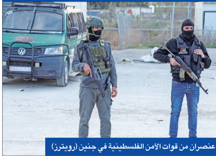
عنصران من قوات الأمن الفلسطينية في جنين