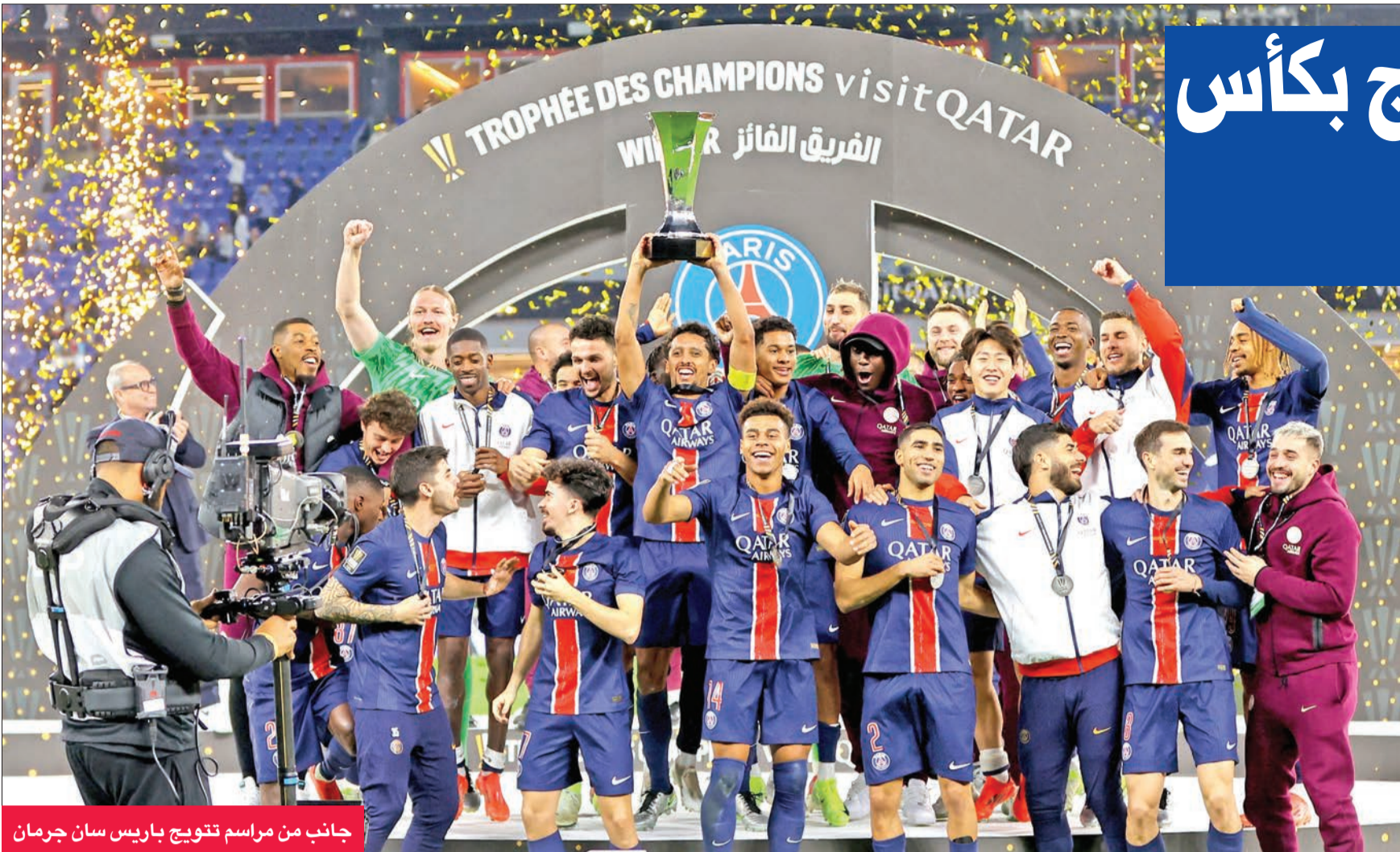
جانب من مراسم تتويج باريس سان جرمان

توج فريق باريس سان جرمان بلقب النسخة 48 من كأس السوبر الفرنسي لكرة القدم، بعد الفوز بهدف على منافسه موناكو مساء الأحد في العاصمة القطرية الدوحة.