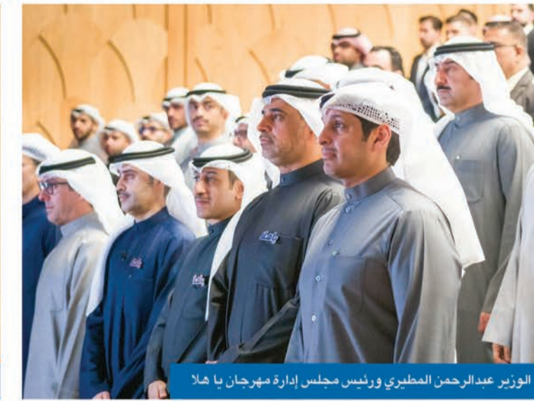
الوزير عبدالرحمن المطيري ورئيس مجلس إدارة مهرجان يا هلا

8 ملايين دولار نقداً واستعرض الدوسري مكونات مهرجان «يا هلا»، الذي يقدم خلال 70 يوماً عروضاً ترويجية وتخفيضات وخصومات وهدايا من قبل المشاركين (المجمعات التجارية ومحال التجزئة والجمعيات التعاونية والأسواق المركزية والشركات الكبرى والتجارة الإلكترونية وقطاعات السيارات والبناء والأثاث والصحة والتجميل والسياحة والترفيه والمطاعم والمقاهي وأنشطة تجارية وخدمية في الكويت). ويحصل كل متسوق خلال فترة المهرجان على كوبون واحد مقابل كل 10 دنانير ينفقها بالشراء من الشركات المشاركة، مما يؤهل للدخول في أحد السحوبات الأسبوعية العشرة الخاصة بالمهرجان.