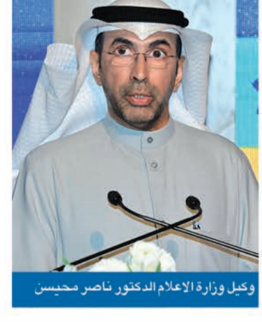
وكيل وزارة الإعلام الدكتور ناصر محيسن