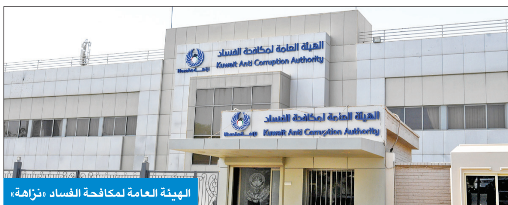
الهيئة العامة لمكافحة الفساد «نزاهة»

بأعلى معايير الاحتراف والسلوك الوظيفي، داعية جميع جهات القطاع العام إلى المشاركة في هذه المبادرة ضمن السنة الثالثة للمشروع لتحقيق التميز المؤسسي والارتقاء به إلى