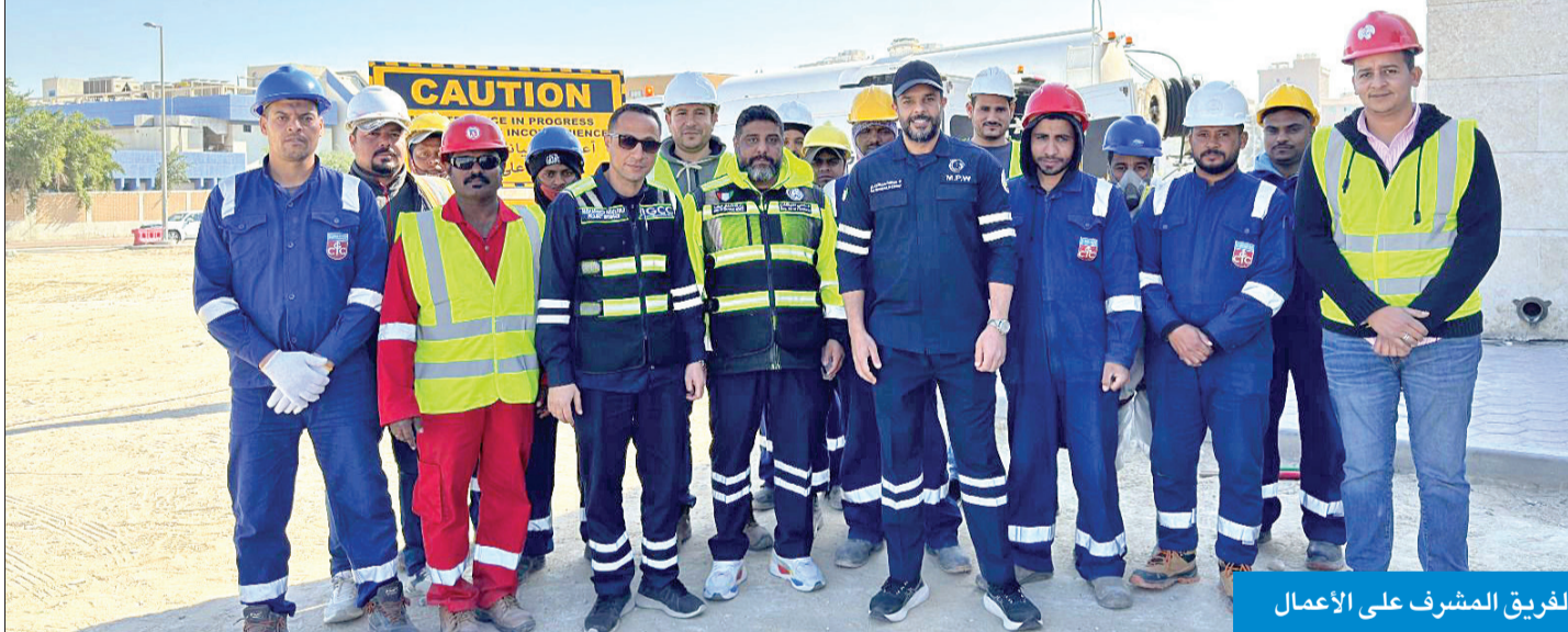
الفريق المشرف على الأعمال

أعمال الرقع المساحي وأعمال الأسفلت. ودعا أهالي منطقة المنقف إلى التعاون مع الجهات المعنية خصوصاً أنه سيتم إغلاق بعض الطرق خلال الفترة المقبلة لأعمال الصيانة. وفي سياق متصل، وافق الجهاز المركزي للمناقصات العامة على ترسية مناقصة دراسة وتصميم أعمال البنية التحتية لمنطقة الفجاء وكيفان والشويخ الإدارية على المناقص صاحب العطاء الأفضل فنياً ومالياً بمبلغ إجمالي 636 ألف دينار للمطابق لشروط والمعايير الفنية.