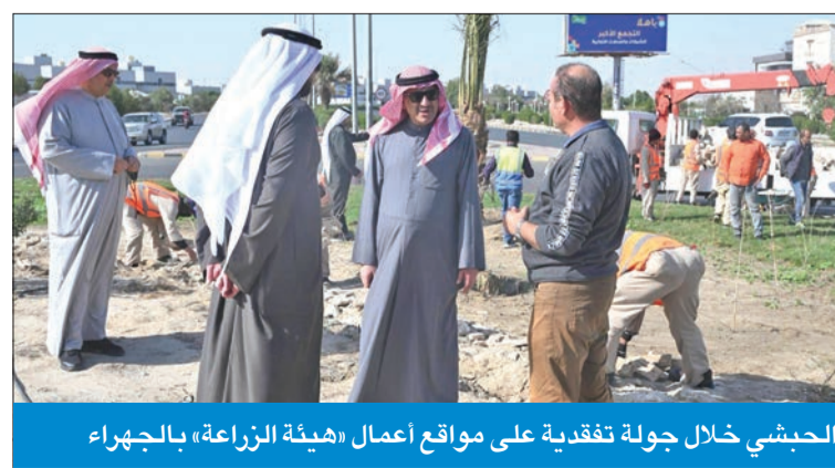
الحبشي خلال جولة تفقدية على مواقع أعمال «هيئة الزراعة» بالجهراء

اطلع على الخطط المستقبلية لتجميل مناطق المحافظة وتخضيرها