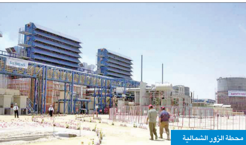
محطة الزور الشمالية

حوالي 100 كيلومتر من جنوب مدينة الكويت على ساحل الخليج العربي. وتهدف هيئة مشروعات الشراكة بين القطاعين العام والخاص ووزارة الكهرباء والماء والطاقة المتجددة من خلال طرح هذا المشروع إلى تشجيع مشاركة القطاع الخاص