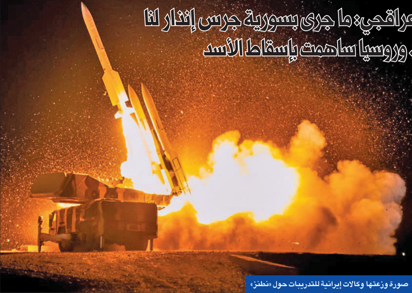
صورة وزعتها وكالات إيرانية للتدريبات حول «نطنز»

● تدريبات إيرانية للدفاع عن منشأة نطنز ● عراقجي: ما جرى بسورية جرس إنذار لنا ● قائد في «الحرس»: الحرب ليست بمصلحتنا... وروسيا ساهمت بإسقاط الأسد