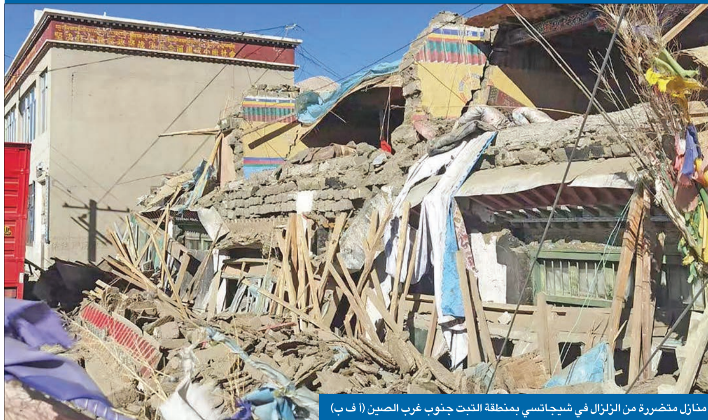
منازل متضررة من الزلزال في شيجاتسي بمنطقة التبت جنوب غرب الصين

400 كيلومتر من مركز الزلزال، قبل أن يفروا من منازلهم. بوتان وولاية بيهار شمال الهند التي تقع على الحدود مع نيبال.