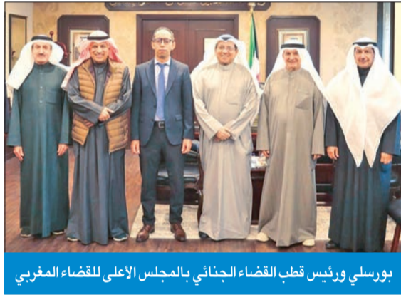
بورسلي ورئيس قطب القضاء الجنائي بالمجلس الأعلى للقضاء المغربي

وأوضح البيان أنه تم خلال اللقاء أيضاً استعراض إمكانية تسهيل إجراءات التقاضي، ورفع صفح الدعاوى إلكترونياً، وتوطيد وتعزيز أواصر التعاون المشترك ووسائل تدعيمها وإثرائها، مضيفاً أن اللقاء جاء على هامش ورشة العمل الإقليمية، التي نظّمها معهد الكويت للدراسات القضائية والقانونية، لمناقشة «مستحدثات مكافحة جريمة غسل الأموال في القانون الوطني والمقارن».