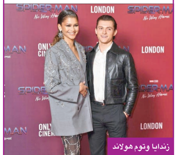
زندايا وتوم هولاند

كشفت وسائل إعلام أميركية عن خطبة الممثلين زندايا وتوم هولاند، بطلي فيلم «سبايدر مان»، في اليوم التالي لاحتفال توزيع جوائز «غولدن غلوب»، التي ظهرت فيها زندايا واضعة خاتماً مرصعاً بماسة ضخمة، وهي قصة بدأت بعد أن التقى الممثلان خلال تصوير «سبايدر مان: هوم كامينغ» (2017). وأثار الحجر الكريم في إصبع الممثلة، البالغة 28 سنة، ردود أفعال كبيرة عبر مواقع التواصل، إذ بدأ عدد من معجبيها يتكهنون باحتمال خطوبتها. وأكد موقع «تي إم زي»، المتخصصة بأخبار المشاهير، هذه الأنباء أمس الأول، مشيراً إلى أن هولاند تقدم بطلب زواج من زندايا في عيد الميلاد. وجثا الممثل البريطاني، (28 عاماً)، على ركبة واحدة «ضمن أجواء حميمة جداً في أحد منازل عائلة زندايا بالولايات المتحدة»، بحسب الموقع، الذي أضاف: «تفيد معلوماتنا بأن توم لم يرغب في أن تكون خطوته عبارة عن استعراض كبير، بل طلب زواج رومانسي جداً»، مشيراً إلى أن «أفراد العائلة لم يكونوا حاضرين، كانت مجرد لحظة خاصة بين توم وزندايا».