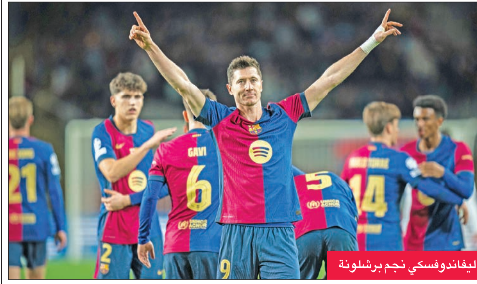
ليونيل ميسي نجم برشلونة

في المقابل، وعلى الرغم من البداية السيئة لريال مدريد في الدوري هذا الموسم، فإنه استعاد توازنه ويتصدر حالياً الترتيب بفارق نقطتين أمام جاره أتلتيكو مدريد الذي لعب مباراة أقل.