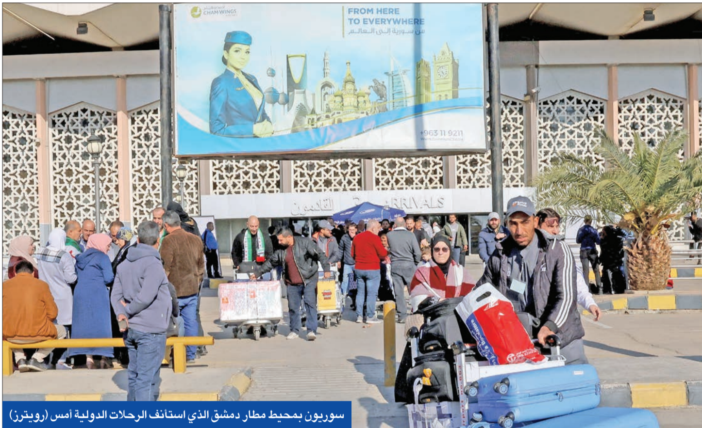
سوريون بمحيط مطار دمشق الذي استأنف الرحلات الدولية أمس

عشية مرور شهر على سقوط نظام الرئيس المخلوع بشار الأسد وسيطرة الفصائل المسلحة بقيادة هيئة «تحرير الشام» على دمشق، أجرى وزير الخارجية بإدارة السورية الجديدة أسعد الشيباني مباحثات مع نظيره الأردني أيمن الصفدي في عمان، أمس، تمخض عنها اتفاق لدفع سبل تعزيز العلاقات الشاملة بين البلدين وآليات التعاون في مجالات عدة منها الحدود والأمن والطاقة والنقل ومحاربة تنظيم «داعش».