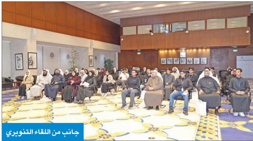
جانب من اللقاء التنويري