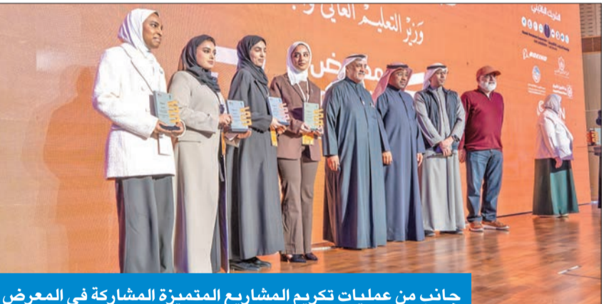
جانب من عمليات تكريم المشاريع المتميزة المشاركة في المعرض

وأضافت أنها تهدف أيضاً من خلال دعم المعرض، الذي تُشرف عليه «الهندسة والبتترول»، إلى تحقيق رؤيتها، المتمثلة في نشر ثقافة علمية وتكنولوجية