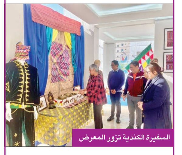
السفيرة الكندية تزور المعرض