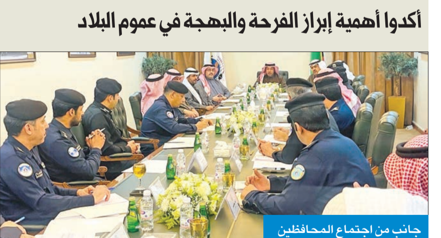
جانب من اجتماع المحافظين

أكدوا أهمية إبراز الفرحة والبهجة في عموم البلاد