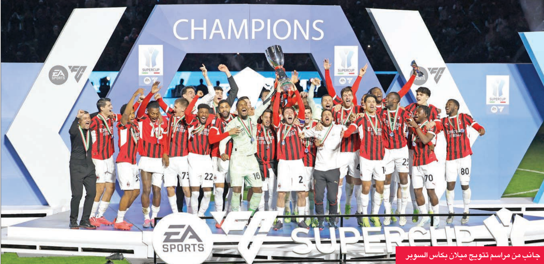
جانب من مراسم تتويج ميلان بكأس السوبر

توج ميلان بطلا لكأس السوبر الإيطالي للمرة الثامنة في تاريخه، بعد فوزه «الملحمي» على غريمه اللدود إنتر (3-2)، بعد أن كان متأخراً بهدفين نظيفين، وذلك في النهائي المثير الذي احتضنه ملعب الأول بارك بالرياض.