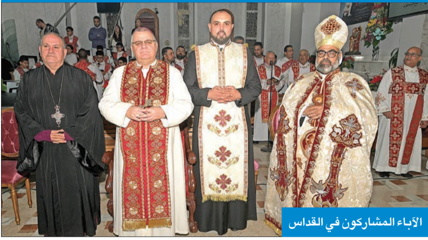
الأباء المشاركون في القديس

الكويت أرض الخير والتسامح والمحبة الأب يسى زكريا