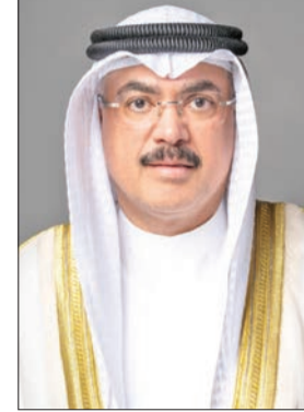
سيد جلال الطبطبائي

أعلنت وزارة التربية وقف لجنة الشكاوى والتظلمات التي تم تشكيلها بموجب قرار وزاري من وزير التربية المهندس سيد جلال الطبطبائي استقبال طلبات التظلمات، وذلك بعد انتهاء الفترة المحددة التي استمرت أسبوعين. وأوضحت «التربية»، في بيان لها أمس، أن اللجنة التي تضم ممثلين عن 4 جهات مختلفة، استقبلت خلال فترة تلقي الطلبات 41 ملفاً تتضمن تجاوزات مالية وإدارية جسيمة، حيث يتم حالياً استكمال مراجعة هذه الملفات بعناية وفقاً للأطر القانونية المعتمدة، لضمان تحقيق العدالة وتعزيز مبدأ الشفافية في التعامل مع الشكاوى والتظلمات. وأكدت أن القطاعات المعنية تعمل على مراجعة ملفات إضافية تتعلق بمستحقاقات مالية وإدارية للعاملين في الوزارة، بالإضافة إلى ملفات ذات طابع قانوني، وذلك استجابة لتوجيهات الوزير الطبطبائي بضرورة الالتزام بالنظم واللوائح القانونية في معالجة القضايا.