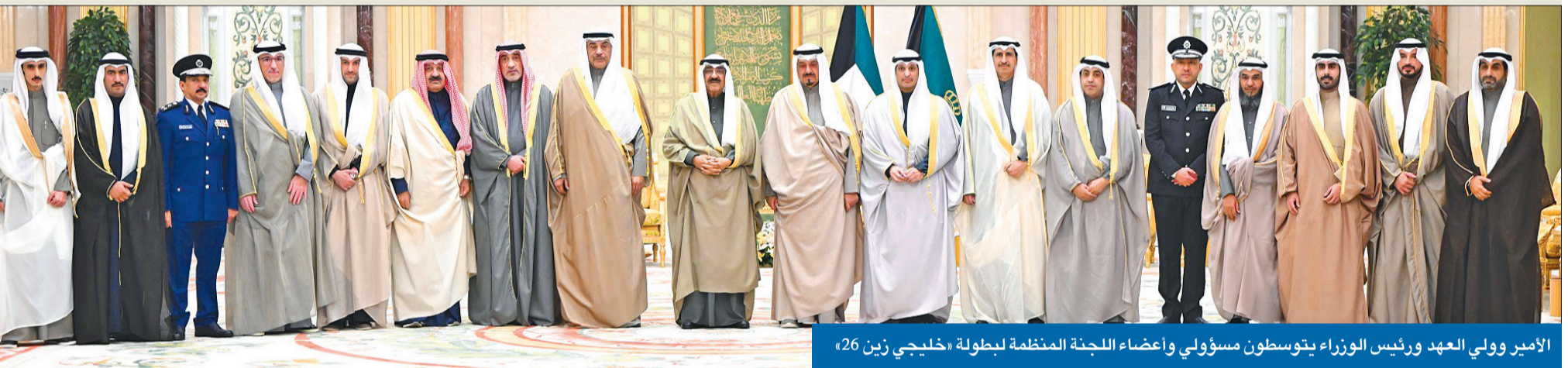
الأمير وولي العهد ورئيس الوزراء يتوسطون مسؤولي وأعضاء اللجنة المنظمة لبطولة «خليجي زين 26»