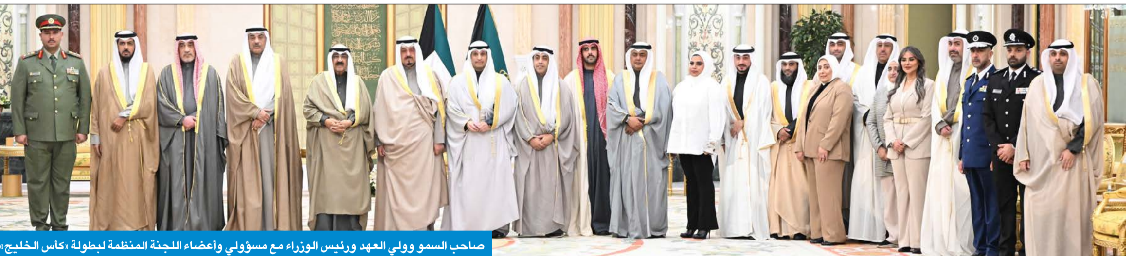
صاحب السمو وولي العهد ورئيس الوزراء مع مسؤولي وأعضاء اللجنة المنظمة لبطولة «كأس الخليج»