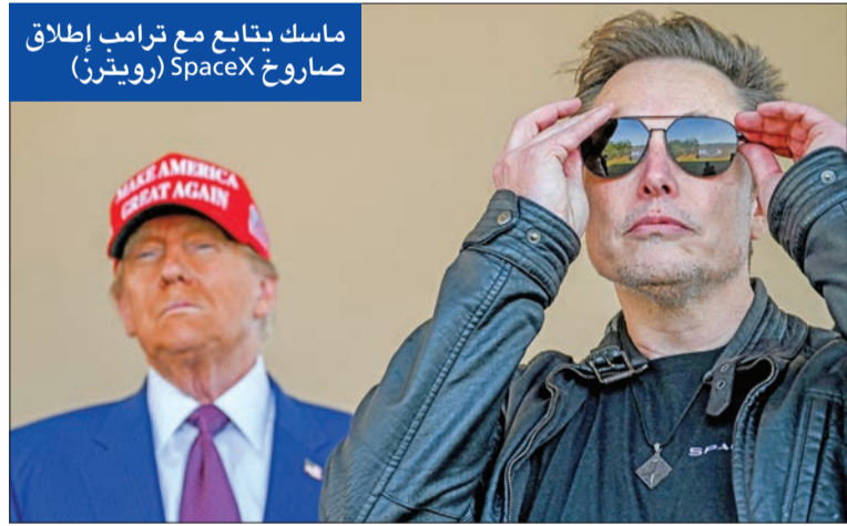
ماسك يتابع مع ترامب إطلاق صاروخ SpaceX

شغله منصب المدعي العام منذ أكثر من عقد، مؤكداً أنه أعاد فتح العديد من القضايا المغلقة وأصلح الطريقة التي يتم بها مقاضاة مثل هذه الجرائم. كما دان «الأكاذيب والمعلومات المضللة» التي قال إنها تقوض الديمقراطية في المملكة المتحدة. وقبل مؤتمر ستارمر، ثبت ماسك رسالة على رأس حسابه في «إكس»: «على أميركا تحرير شعب بريطانيا من حكومتهم الاستبدادية». وفي إشارة إلى نفوذ أغنياء العالم، كشفت وزيرة الداخلية، بيفيت كوبر، التي انتقدتها ماسك بشدة، عن تشريع يجعل التنس أو الفشل في الإبلاغ عن مزاعم استغلال الأطفال الجنسي جريمة.