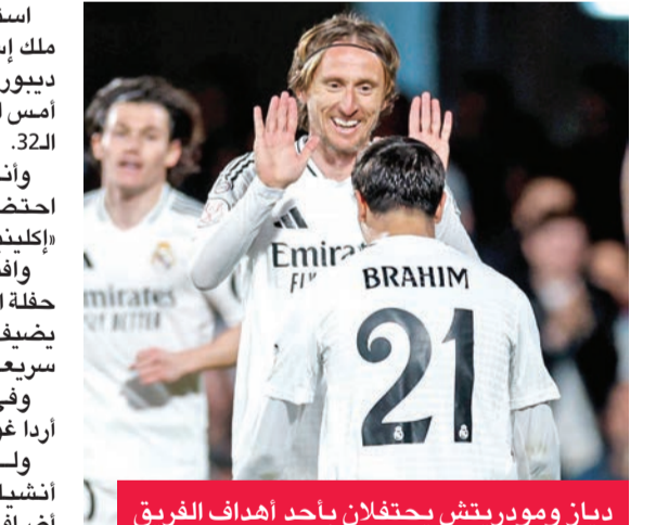
دياز ومودريتش يحتفلان بأحد أهداف الفريق

الهدف الرابع في الدقيقة 55. ثم عاد غولر ليخمس على الهدف الشخصي الثاني له، والخامس قبل دقيقتين من نهاية الوقت الأصلي. وبهذه النتيجة العريضة يلتحق الميريغني بركب المتأهلين لثمن النهائي. وستقام قرعة دور الـ 16 اليوم بمقر الاتحاد الإسباني لكرة القدم في مدريد، بينما ستقام مبارياته في وقت لاحق من هذا الشهر. ويستعد الريال للسفر إلى السعودية من أجل خوض بطولة كأس السوبر الإسباني. وسيستهل بطل الليغا حملة الدفاع عن لقبه في البطولة في نصف النهائي الثاني الخميس أمام وصيف كأس الملك للموسم الماضي مايوركا على ملعب مدينة الملك عبدالله الرياضية في جدة.