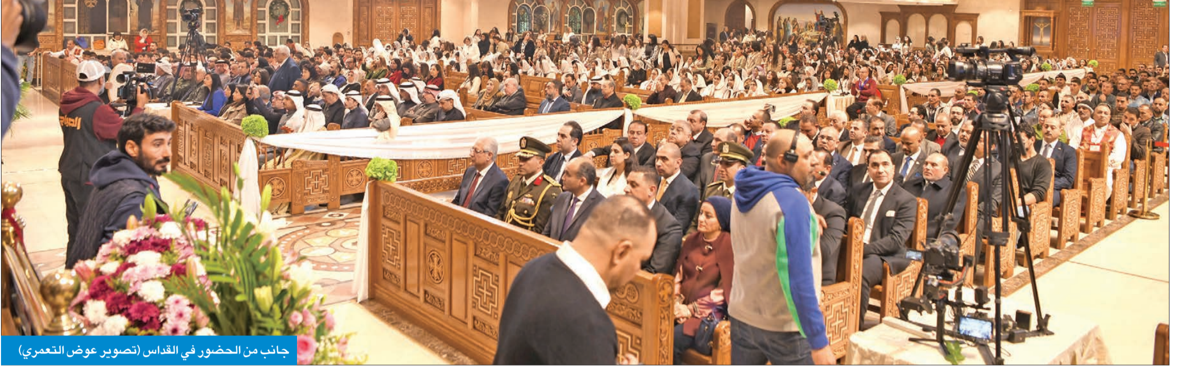
جانب من الحضور في القديس