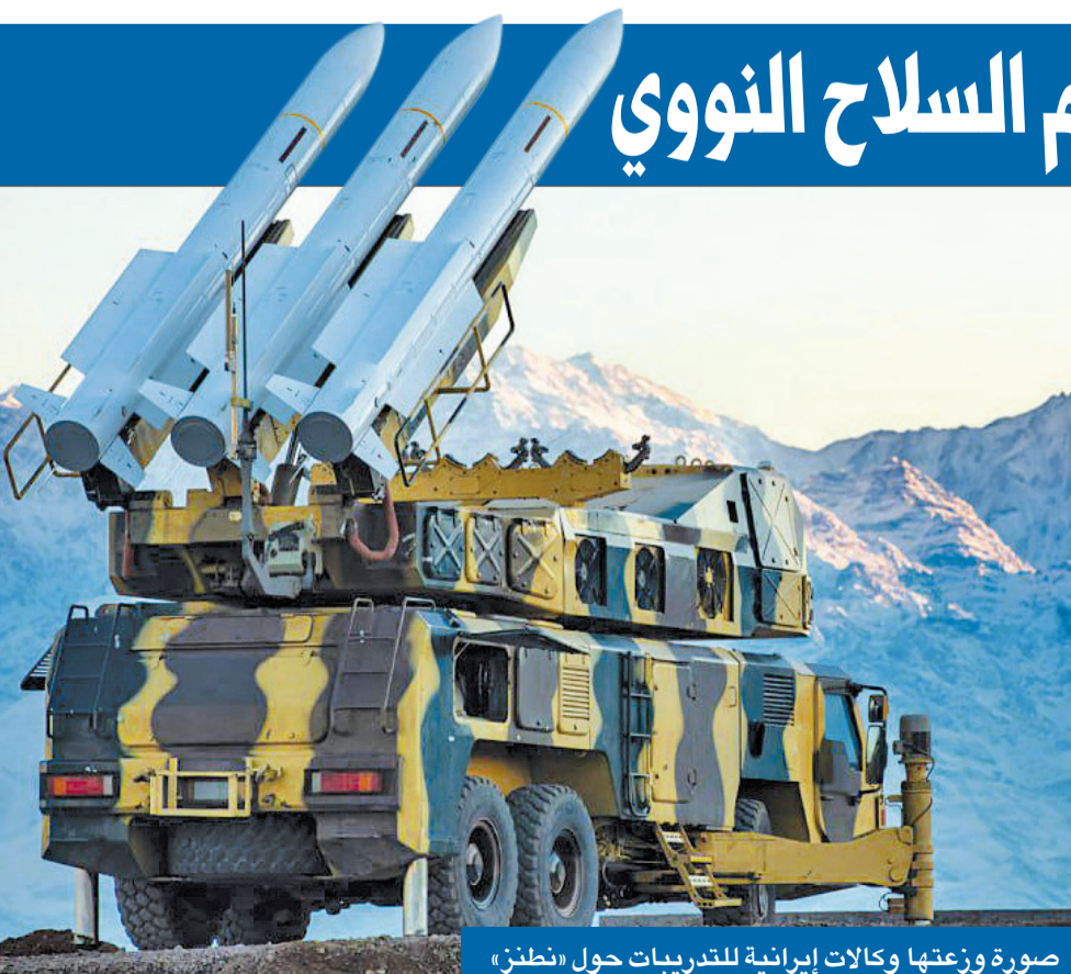
صورة وزعتها وكالات إيرانية للتدريبات حول «نطنز»

جو بايدن قبل 20 الجاري، موعد تولى ترامب السلطة، يتضمن ضرب منشآت نووية وبنى تحتية. وتشير تقديرات الأجهزة الأمنية الإيرانية إلى وجود معارضة أميركية لسيناريو مثل هذا، خصوصاً من جانب القيادات العسكرية وبعض المسؤولين في البيت الأبيض الذين يخشون قيام طهران برد خارج عن السيطرة، مثل ضرب قواعد أميركية في دول مجاورة، الأمر الذي لن يؤدي فقط إلى تعريض عسكريين أميركيين ومصالح أميركية للخطر، بل سيفجر توترات إقليمية لا يمكن تقدير شكلها ومداها.