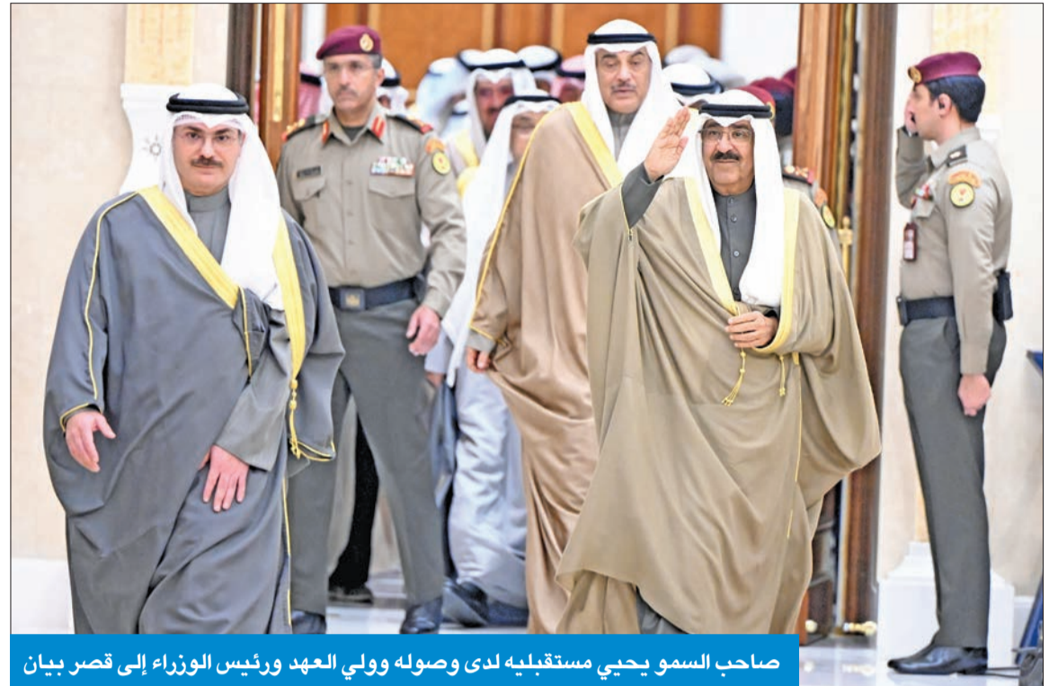
صاحب السمو يحيى مستقبليه لدى وصوله وولي العهد ورئيس الوزراء إلى قصر بيان

أكد صاحب السمو أمير البلاد، الشيخ مشعل الأحمد، أن العطاء للوطن بهمة وإصرار ووضع الكويت في القلب ونصب العيون والعمل بروح الفريق الواحد من ركائز النجاح والتميز، مشيراً سموه إلى أن أبناء الكويت المخلصين أثبتوا ذلك في استضافة بطولة كأس الخليج العربي لكرة القدم السادسة والعشرين، وأكدوا أن العلاقات الأخوية والروح الرياضية أسمى فوز وأرفع تتويج.