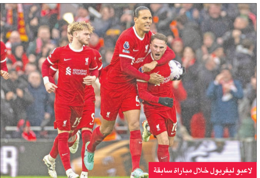
لاعبو ليفربول خلال مباراة سابقة

بإمكانهم إعادة الفريق إلى وضعه الصحيح والمنافسة على جميع الألقاب، وعلى رأس هؤلاء الكوري الجنوبي هيوغ مين سون، الذي تم تمديد عقده مع الفريق حتى عام 2026. وانضم سون (32 عاماً) إلى توتنهام عام 2015 قادماً من بايرن ليفركوزن الألماني، وشارك في 431 مباراة، سجل خلالها 169 هدفاً، وأصبح رابع أفضل هدافي ناديهِ منذ تاسيسه.