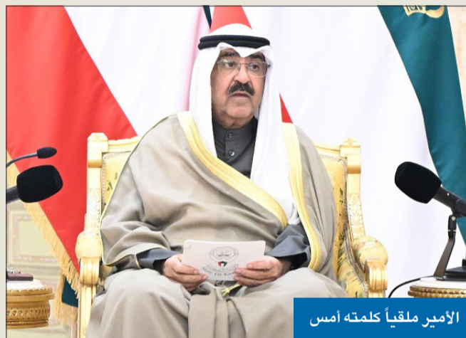
الأمير ملقياً كلمته أمس