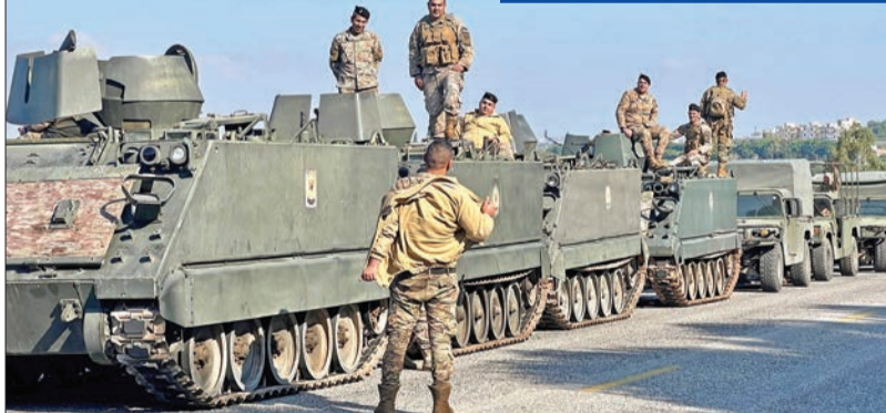
جنود لبنانيون في الناقورة التي انسحب منها الجيش الإسرائيلي أمس الأول

وهو يستمر في الإنيات لي وليقبة أعضاء اللجنة أن لديه القدرة والنية والقيادة لتأمين لبنان والدفاع عنه. فهو تصرف بحزم وسرعة وبخبرة واضحة».