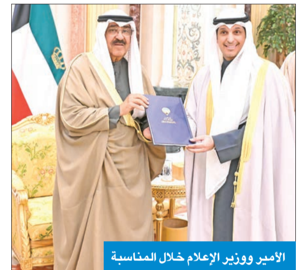
الأمير ووزير الإعلام خلال المناسبة

وأضاف سموه: نتقدم بداية في هذا اللقاء بالشكر الجزيل