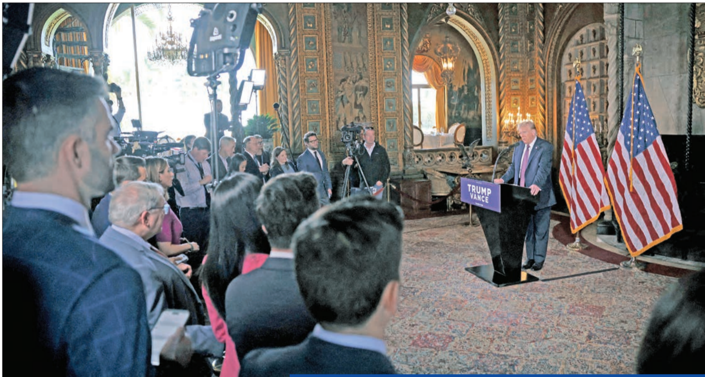
ترامب خلال مؤتمره الصحفي بمقره في مارلاغو بفلوريدا أمس الأول

«عاد ترامب وعادت الفوضى»، هكذا عنوانت صحيفة نيويورك تايمز، تعليقا على المؤتمر الصحفي الذي عقده الرئيس الأميركي المنتخب دونالد ترامب، أمس الأول، في مقره بفلوريدا، حيث عرض فيه أجندة سياسته الخارجية، قبل أقل من أسبوعين على تنصيبه رسمياً. ولم يستبعد ترامب في المؤتمر الصحفي استخدام القوة العسكرية للسيطرة على قناة بنما وإقليم غرينلاند القطبي، بينما هدد كندا بفرض تعريفات جمركية قاسية، مما سيجعلها «تستسلم للضم».