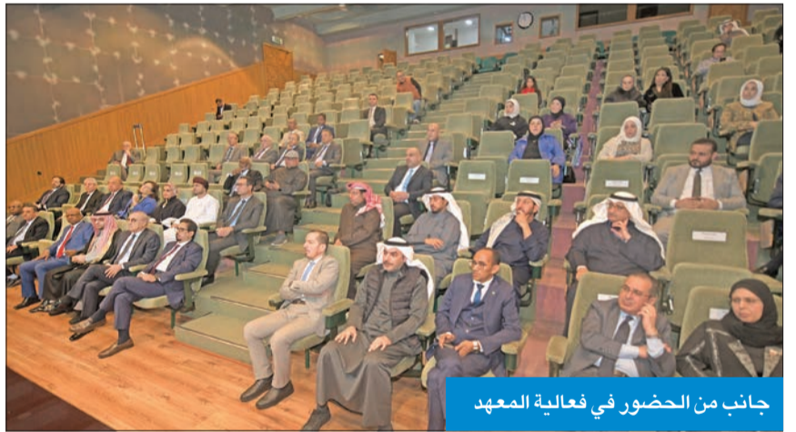
جانب من الحضور في فعالية المعهد

مواكبة لخطط الإصلاح الشامل خصوصاً المالي والإداري، أطلق المعهد العربي للتخطيط المرحلة الثانية من مؤشر كفاءة الإنفاق الحكومي في الدول العربية، بما يحقق التنمية المستدامة في الدول العربية عموماً، ودولة الكويت خصوصاً، بحضور أعضاء مجلس أمناء المعهد، وممثلي السلك الدبلوماسي العربي بالكويت، وممثلين عن الأجهزة المعنية بقضايا الإصلاح الاقتصادي والمالي.