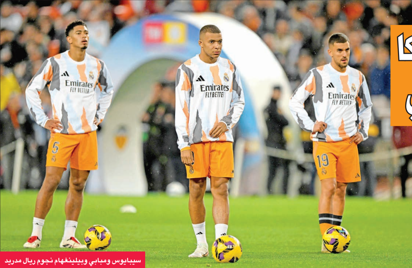
سيبايوس ومبابي وبيلينغهام نجوم ريال مدريد