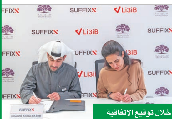
خلال توقيع الاتفاقية