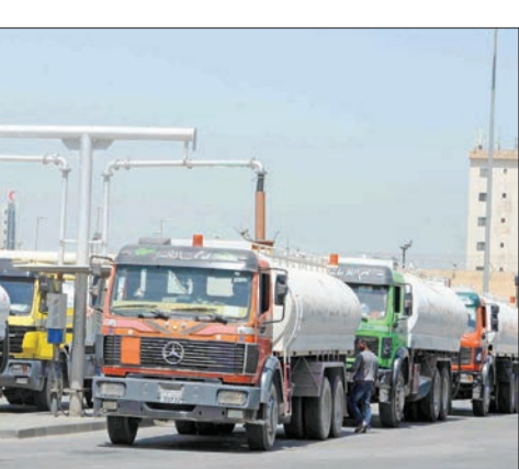
جانب من إحدى محطات تعبئة المياه

أحالت وزارة الكهرباء والماء والطاقة المتجددة مؤخراً مناقصة إنشاء وإنجاز وصيانة محطة تعبئة المياه بمنطقة غرب الفينطيس، بكلفة إجمالية بمبلغ 1.495 مليون دينار إلى ديوان المحاسبة، للدراسة والتدقيق. وأشارت مصادر «الكهرباء» إلى أن الوزارة بانتظار موافقة الديوان على التعاقد مع المقاول الفائز لتوقيع العقد، ومن ثم البدء في إنجاز الأعمال، طبقاً لاشتراطات التعاقدية المنصوص عليها في العقد.