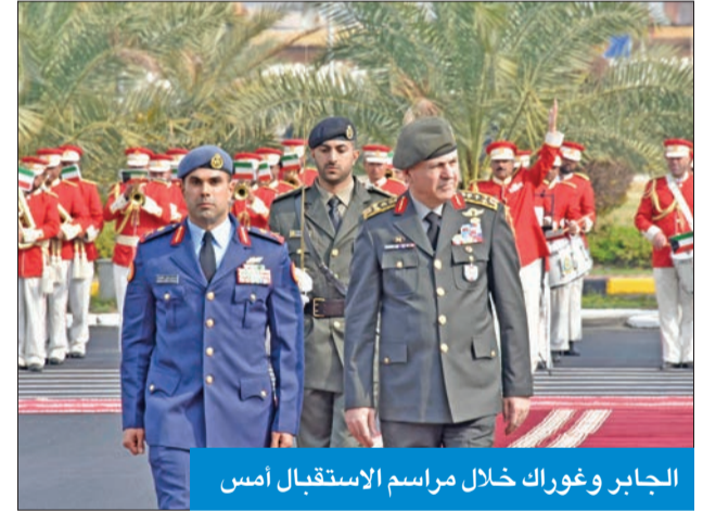
الجابر وغوراك خلال مراسم الاستقبال أمس

استقبل نائب رئيس الأركان العامة للجيش اللواء الركن الطيار صباح الجابر، أمس، رئيس هيئة الأركان العامة للجيش التركي الفريق أول ماتين غوراك والوفد المرافق له، بمناسبة زيارته الرسمية للبلاد، حيث أقيمت للضيف مراسم استقبال رسمية.