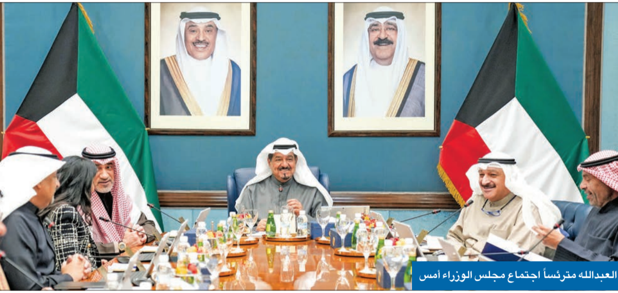
العدالله مترئساً اجتماع مجلس الوزراء أمس

مجلس الوزراء اطلع على خطة الطبطيني بشأنها وكلفه وضع جدول زمني لتنفيذها تذليل المعوقات لتنظيم «الكويت عاصمة الثقافة العربية والإعلام العربي 2025»