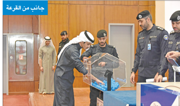
جانب من القرعة

منهم في القرعة العلنية، إلى جانب تحديد 15 متقدماً كقائمة احتياطية. وأشار البيان إلى أن الدورات التخصصية التي تم الإعلان عنها هي «دورة وكيل ضابط»، وتتضمن 3 تخصصات رئيسية هي (قائد زورق -