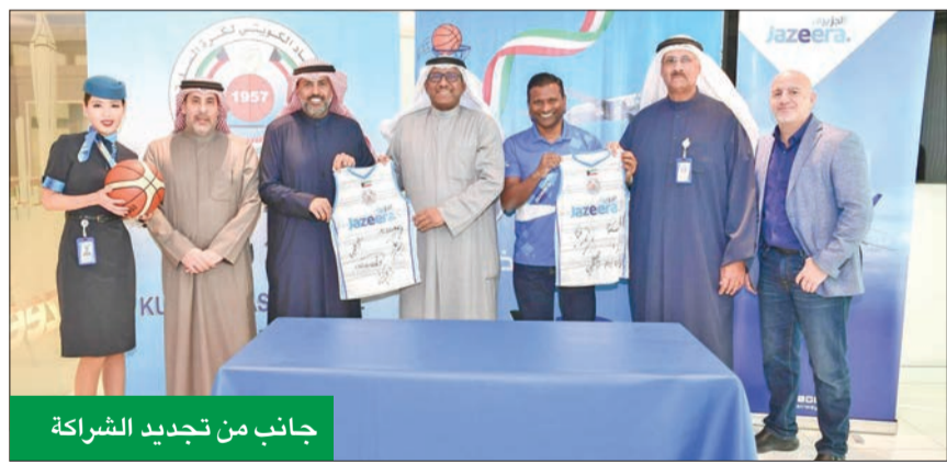
جانب من تجديد الشراكة

الكويت، وعلى التفاعل المتميز أثناء المباريات، وعلى الجوائز القميمة المقدمة.