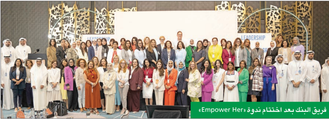
فريق البنك بعد اختتام ندوة «Empower Her»