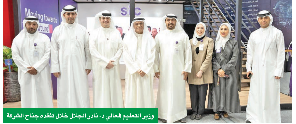
وزير التعليم العالي د. نادر الجلال خلال تفقده جناح الشركة