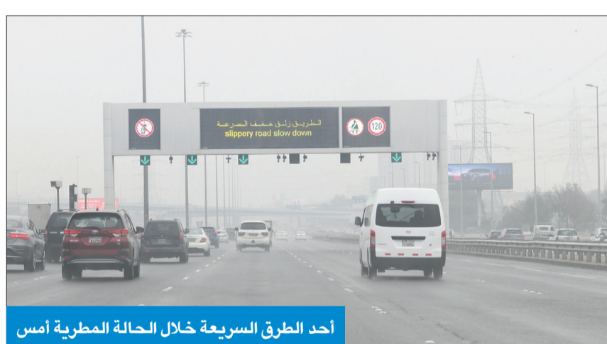
أحد الطرق السريعة خلال الحالة المطرية أمس

«تراوحت بين 2 و7 ملم... وانخفاض في الرؤية بسبب الضباب»