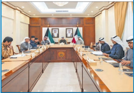
جراح الجابر مترأساً اجتماع لجنة الحدود أمس

ترأس نائب وزير الخارجية، السفير الشيخ جراح الجابر، أمس، اجتماع لجنة الحدود، الذي عقد في وزارة الخارجية، حيث تم بحث جميع المواضيع المدرجة على جدول الأعمال.