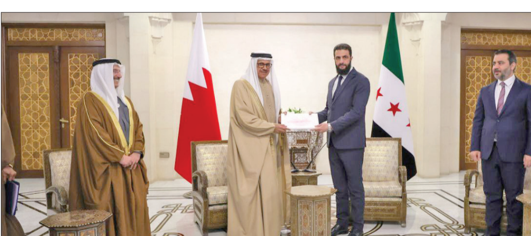
الشرع مستقبلاً الزياني في قصر الشعب بدمشق أمس (إكس)

واتهم النظام السابق بالتعامل بالفساد والمحسوبية في تعيين الموظفين، مؤكداً أن الواقع يشير إلى وجود نحو 900 موظف بعضهم كان مسجلاً على الورق فقط لأخذ الراتب دون عمل، وأن هناك 300 ألف موظف ستشطب أسمائهم. وبعد يوم من إعلان وزير الخارجية السوري تاجيل مؤتمر الحوار الوطني إلى موعد يحدد لاحقاً، توقع مصادر أن يعقد الاجتماع الجامع في فبراير المقبل، فيما دعت شخصيات سورية إلى إصدار مؤقت يملا الفراغ الدستوري الذي تعاني منه البلاد بعد تجريد العمل بدستور 2012 إثر سقوط الأسد. في موازاة ذلك، تعهد وزير الدفاع السوري مرفع ابوقصرة بـ «العمل على إعادة الجيش لهدفه الأساسي حامياً للديار وبتقليل الفجوة بين الجيش والشعب». وقال ابوقصرة خلال جلسة مع فصائل مسلحة ضمن جهود توحيد المؤسسة العسكرية وأخراتها بوزارة الدفاع: «لقد اكسب النظام البائد الجيش سمعة سيئة، وأصبح اسمه مدعاة للخوف والوجل من الشعب». وبينما يشكل الفراغ الأمني إلى جانب الاشتباكات العسكرية بين الفصائل بيئة مثالية لتنظيم «داعش» لاستعادة نشاطه وترتيب صفوفه، ذكر المرصد السوري لحقوق الإنسان أنه منذ سقوط النظام قتل 131 مواطن، 67 جريمة في اللاذقية، وطرطوس بالساحل، وحمص، وحمص، داعياً إدارة العمليات العسكرية الجديدة إلى التصدي للجرائم التي تؤثر على السلم الأهلي فوراً، ومنع انتشار الذعر بين صفوف المدنيين.