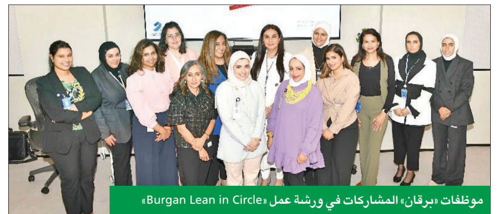
موظفات «برقان» المشاركات في ورشة عمل «Burgan Lean in Circle»