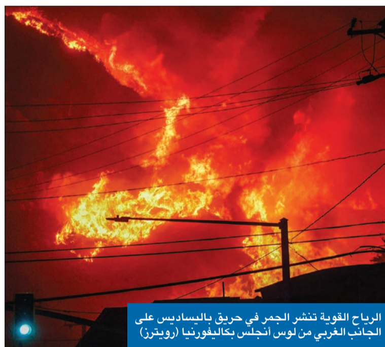
الرياح القوية تنشر الجمر في حريق باليساديس على الجانب الغربي من لوس أنجلوس بكاليفورنيا

ترك أكثر من 30 ألف شخص منازلهم بعد أن اجتاحت حرائق الغابات منطقة ساحلية في لوس أنجلوس بالولايات المتحدة في غضون ساعات قليلة، كما انتشر حريق ثانٍ بسرعة أمس الأربعاء على مسافة نحو 50 كيلومتراً من الساحل.