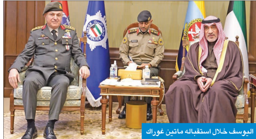
اليوسف خلال استقباله ماتين غوراك

المجالات، ولا سيما في المجال العسكري، وتم خلال اللقاء، الذي حضره نائب رئيس الأركان العامة