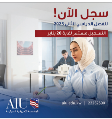
السعيدين الأكاديمي والشخصي.

وشددت على أنها تلتزم بتوفير بيئة تعليمية متمحور حول الطالب، مع التركيز على التعلم التطبيقي الذي يُعد الطلاب لمتطلبات سوق العمل العالمي، بالإضافة إلى أن الطلاب يحصلون على شبكة دعم قوية وفرص تعليمية متميزة وكرم جامعي محفز يهدف إلى تطوير قادة المستقبل.