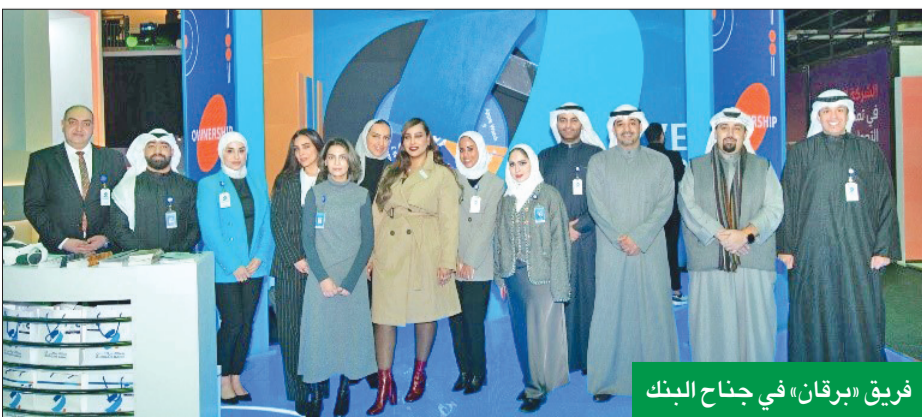
فريق «برقان» في جناح البنك