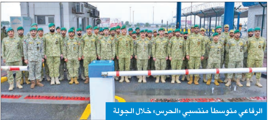
الرفاعي متوسطاً منتسبي «الحرس» خلال الجولة

الرفاعي تفقد كتائب تأمين المنشآت النفطية و«وقود صباحان»