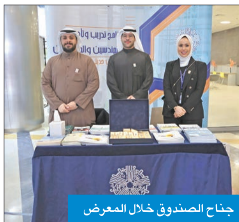
جناح الصندوق خلال المعرض

شارك الصندوق الكويتي للتنمية في معرض التصميم الهندسي الذي أقيم في كلية الهندسة والبتترول بجامعة الكويت، برعاية وزير التعليم العالي والبحث العلمي د. نادر الجلال، واختتم أمس. وأعلن الصندوق، في بيان له، أن مشاركته جاءت انطلاقاً من رؤيته في دعم الشباب وتعزيز مشاركتهم العلمية والهندسية التي تسهم في تطوير البنية التحتية والاقتصاد المحلي. واحتوى جناح الصندوق على مجموعة متنوعة من مطبوعاته وإصداراته الإعلامية التي تبرز إسهاماته على المستويين المحلي والدولي، إلى جانب التعريف «ببرنامج تدريب وتأهيل المهندسين والمعماريين الكويتيين حديتي التخرج» الذي أطلقه عام 2004 بهدف دعم جهود التنمية البشرية وتعزيزاً لمسؤوليته الاجتماعية داخل البلاد. وشهد المعرض تفاعلاً كبيراً من الزوار مع المشاريع