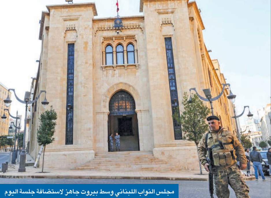
مجلس النواب اللبناني وسط بيروت جاهز لاستضافة جلسة اليوم