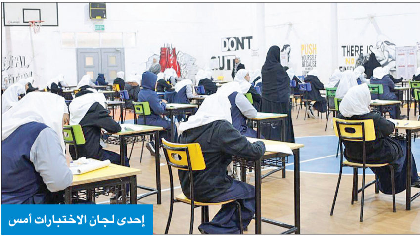
إحدى لجان الاختبارات أمس

نسبة النجاح بالرياضيات تجاوزت الـ 75% و«الفرنسية» لامست الـ 80%