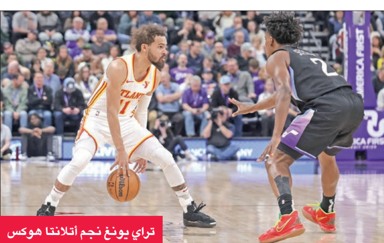
تراي يونغ نجم أتلانتا هوكس