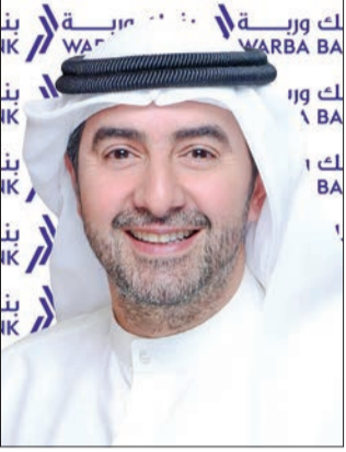
حمد مساعد السائر

● السائر: لتعزيز حضور «وربة» في القطاع المصرفي الإسلامي عبر الاستثمار بفرص استراتيجية