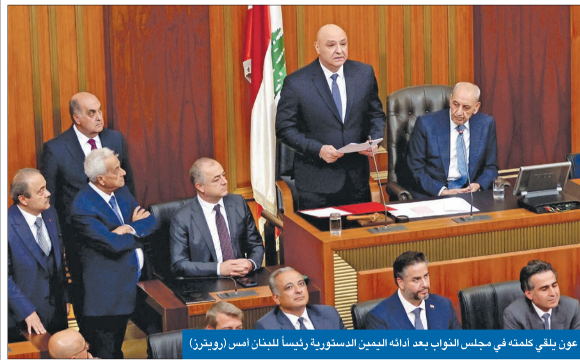
عون يلقي كلمته في مجلس النواب بعد أدائه اليمين الدستورية رئيساً للبنان أمس

بعد أكثر من عامين من شغور المنصب، انتخب البرلمان اللبناني، أمس، قائد الجيش جوزيف عون، رئيساً للجمهورية، عقب ضغوط دولية وإقليمية وحرب مدعومة لأعباء محلياً رئيسياً هو حزب الله وآخر إقليمياً هو إيران، خصوصاً بعد سقوط نظام حليفهما الأوفى بشار الأسد في سورية المجاورة.