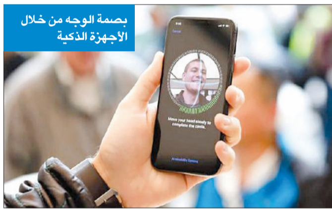
بصمة الوجه من خلال الأجهزة الذكية

بينما واجه موظفو وزارة التربية معوقات بشأن إثبات وجودهم أثناء الدوام، أكدت مصادر رفيعة في ديوان الخدمة المدنية لـ «الجريدة» أنه يتم حالياً العمل على إدخال صلاحيات لموظفي «التربية» لإجراء البصمة عن طريق الهواتف الذكية، حيث يمكن للموظف إثبات حضوره ووجوده وانصرافه من خلال هاتفه الذكي، دون الحاجة للذهاب إلى أجهزة البصمة.