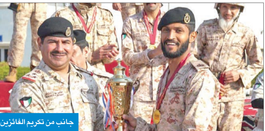
جانب من تكريم الفائزين

تهدف إلى رفع اللياقة البدنية لمنتسبي الجيش وتعزيز روح التنافس