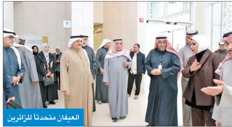
العيغان متحدثاً للزائرين

خلال زيارة «المحاسبة» و«الفتوى والتشريع» و«المراقبة المالية» لـ «الشداية»