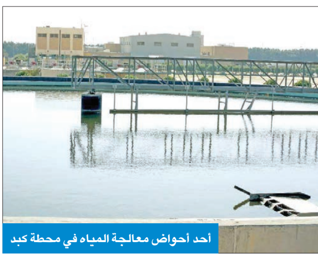
أحد أحواض معالجة المياه في محطة كبد

وأكدت أن تلك المشاريع من شأنها أن تدعم القطاعين الصناعي والزراعي، إضافة إلى دعم البيئة الكويتية، التي أنشئت من أجلها تلك المشاريع، وتسعى الوزارة إلى التوسع فيها من خلال خطة لتعظيم الاستفادة وفقاً لتوجيهات مجلس الوزراء بهذا الخصوص، بالتنسيق مع وزارة الكهرباء والماء وجهات الدولة ذات العلاقة.