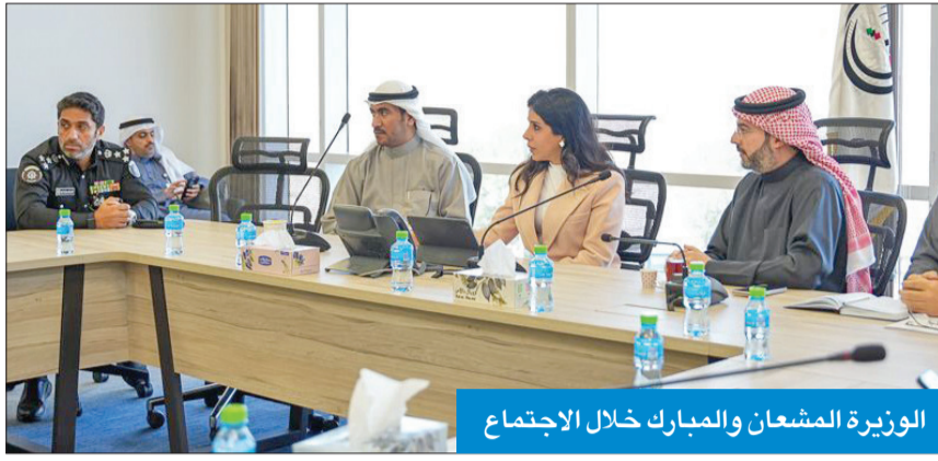
الوزيرة المشعان والمبارك خلال الاجتماع

حسب متطلبات العقد، حيث تمت إزالة المعوقات الموجودة بالشروع بالتعاون مع الجهات المعنية متمثلة في وزارة الداخلية ووزارة الكهرباء والماء وجهات معنية أخرى. وبيّن الوزير أنه جار اعتماد المواد المستخدمة والمعدات والشركات المتخصصة المقدمة من طرف المقاول، بالتنسيق مع استشاري العقد والجهاز الإشرافي في الوزارة والجهات الحكومية ذات الصلة.