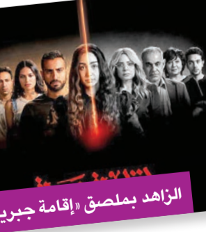
الزاهد بملصق «إقامة جبرية»

يستعد عدد من المطربين لإطلاق ألبوماتهم الجديدة خلال الفترة القادمة، بالتعاون مع بداية العام الجديد، حيث حرص عدد منهم على التواجد مع جمهورهم بداية العام. وأنشده المطرب أحمد سعد من تحضيرات ألبومه الجديد باسم «حبيبنا»، والمقرر إطلاقه خلال الأيام القليلة القادمة، الذي يضم عدداً من الأغاني ذات الألوان الغنائية المختلفة، وتعاون فيه مع عدد كبير من ضناع الموسيقى. وبين اللهجتين المصرية واللبنانية