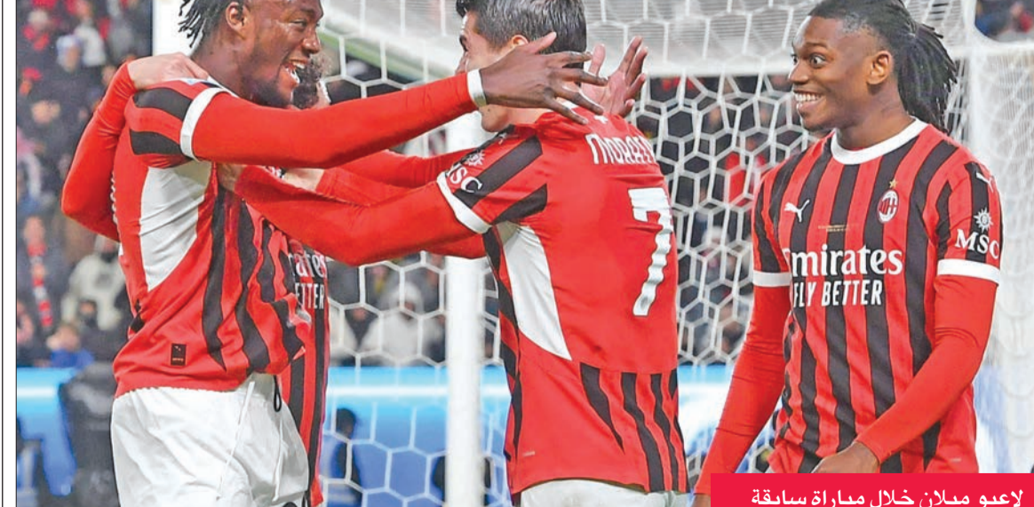
لاعبو ميلان خلال مباراة سابقة

بعد خروجه من نصف نهائي كأس السوبر، ووقف نزيه النقاط في الدوري هذا الموسم، لكنه سقط في فخ التعادل 11 مرة، بينها خمس مرات في مبارياته الست الأخيرة.