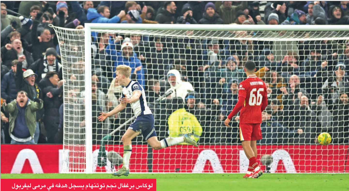
لوكاس برغفال نجم توتنهام يسجل هدفه في مرمى ليفربول

حسم توتنهام مباراته مع ليفربول (حامل اللقب) 0-1 أمس الأول الأربعاء، في ذهاب نصف نهائي كأس رابطة الأندية الإنكليزية المحترفة لكرة القدم، وسجل السويدي لوكاس برغفال هدف المباراة الوحيد (86).