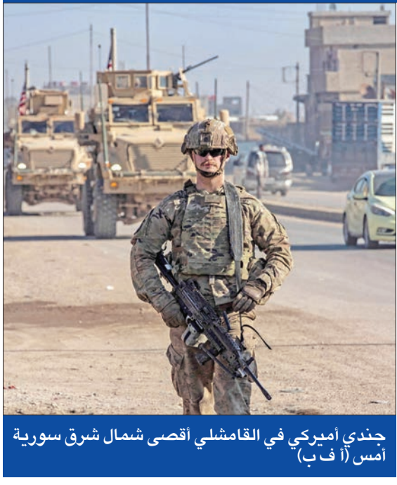
جندي أميركي في القامشلي أقصى شمال شرق سورية

في المقابل لن تقبل تشظي القوات، بل تكون كتلة واحدة وتحمي بشكل رئيس مناطق شمال وشرق سورية، ذات الأغلبية الكردية». إلى ذلك، يصل اليوم وزير الخارجية الإيطالي، أنتونيو تاباتا، إلى دمشق بعد ترؤسه الاجتماع الأوروبي - الأميركي المشترك في روما بشأن آخر المستجدات عقب سقوط الأسد، حيث سيعلم عن «حزمة أولى من المساعدات للتعاون التنموي لسورية، الخارجة من نزاع استمر أكثر من 13 عاماً. ميدانياً، أسهمت الوثائق التي تركها النظام السابق في مسار أجهزته الأمنية، بعد سقوطه والهروب العشوائي لقادة تلك الأجهزة، في تداول هذه الوثائق على نطاق واسع بين المواطنين الذين اعتبرها بعضهم أدلة لإدانة لتعاون بعض الأشخاص مع أجهزة النظام، واستندوا لها للقيام بعمليات انتقامية، فيما هُزّت جريمة جديدة مدينة جبلة على الساحل السوري، إذ شهدت بلدة عين الشرقية تصفية جماعية لثلاثة أشخاص هم أب وابنه وابن