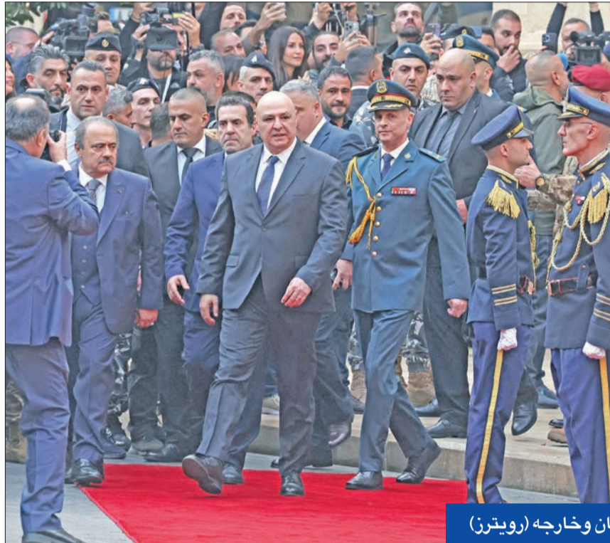
عون بعد انتخابه داخل البرلمان وخارجه

● فاز بـ 99 صوتاً في البرلمان بالدورة الثانية من الاقتراع ليصبح خامس قائد جيش يتولى الرئاسة ● تعهد في خطاب القسم بالعمل على قانون لاستقلالية القضاء واستراتيجية دفاعية وإعمار الجنوب