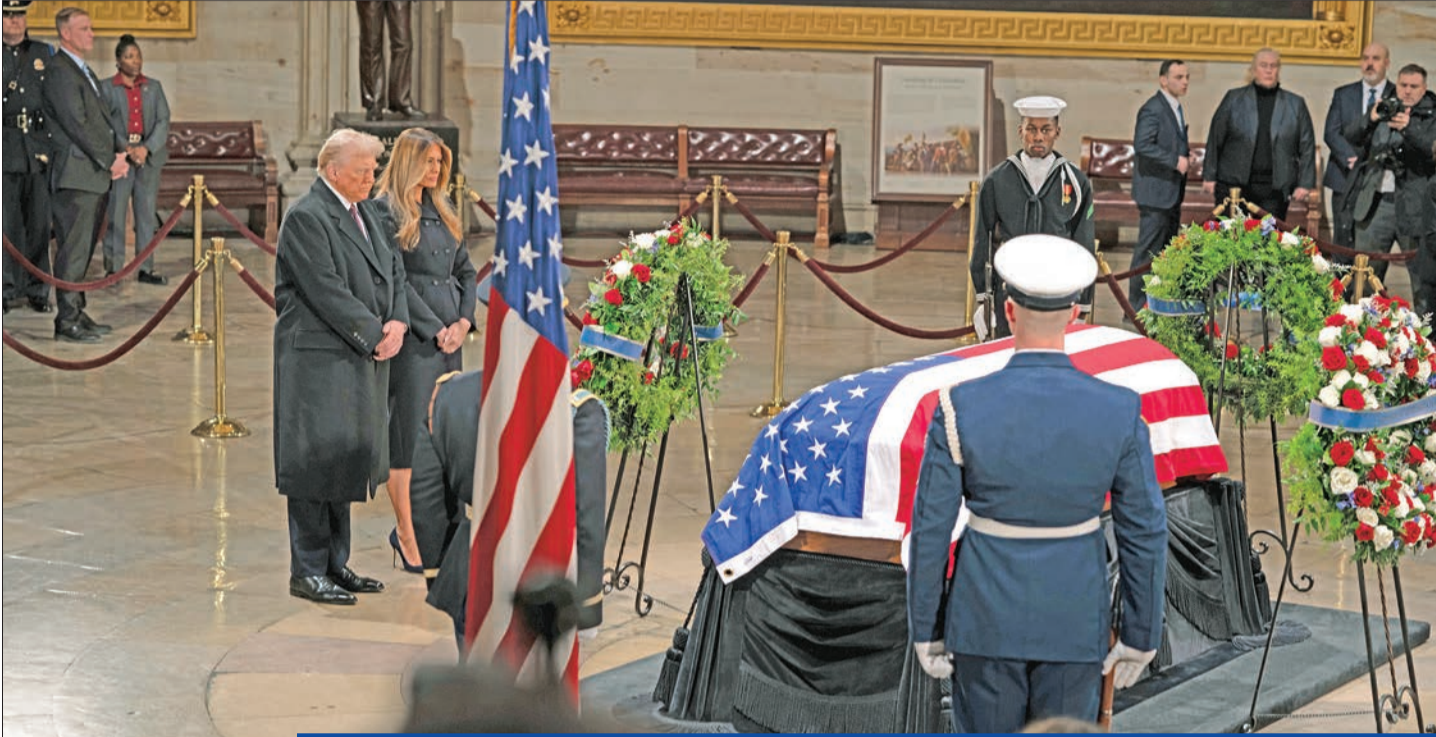
ترامب وزوجته ميلانيا يودعان جثمان الرئيس السابق جيمي كارتر قبل تشييعه في واشنطن أمس بجنائزة وطنية توحت تكريماً استمر أياماً عدة للحائز جائزة نوبل للسلام والذي ترك بصمته على تاريخ أميركا والعالم

مطالباته بزيادة الإنفاق الدفاعي وتهديداته لغرينلاند وكندا تخيف الحلفاء وتشجع الخصوم