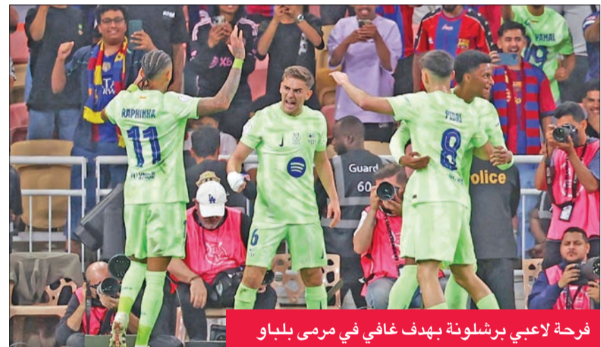
فرحة لاعبي برشلونة بهدف غافي في مرمى بلباو

وبدأ فريق المدرب الألماني هانزي فليك اللقاء بقوة، وكان يفتتح التسجيل بعد مرور 4 دقائق