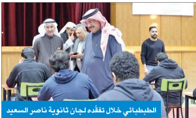
الطبيباني خلال تفقده لجان ثانوية ناصر السعيد

واصل وزير التربية، سيد جلال المطبطيني، جولاته التفقدية لمتابعة سير امتحانات الصف الـ 12، حيث تفقد الوزير لجان الاختبارات في ثانوية ناصر السعيد بمنطقة حولي التعليمية، للاطلاع على جاهزيتها والإجراءات المتخذة لضمان توفير الأجواء المناسبة للطلبة.