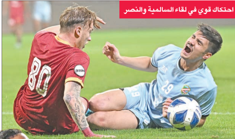
احتكاك قوي في لقاء السالمية والنصر

العربي جماعية في الأداء... والقادسية فاعلية هجومية والكويت لم يحسن التعامل