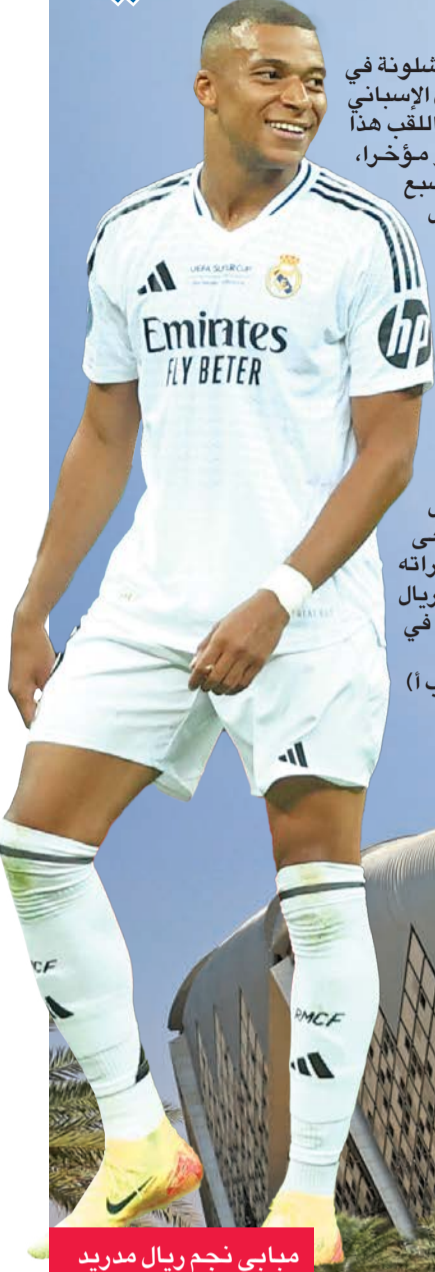
مبابي نجم ريال مدريد

ثم مايوركا في كأس السوبر في المقابل، كان يبدو أن برشلونة في طريقه للاحتفال بصدارة الدوري الإسباني والاقتراب بقوة من التتويج بلقب هذا الموسم، ولكن الفريق تعثر مؤخراً، وحقق انتصاراً وحيداً في آخر سبع مواجهات بالدوري، وهو ما جعل الفريق يتراجع للمركز الثالث، وأنهى برشلونه، بقيادة فليك، عام 2024 بهزيمتين أمام ليفانغيس وأتلتيكو مدريد، ولكن مع بداية هذا العام، تمكن الفريق من تحقيق الفوز في مباراته، حيث تغلب على بارباسترو برعاية نظيفة في كأس ملك إسبانيا وعلى بلباو بهدفين نظيفين في قبل نهائي كأس السوبر، ويسعى برشلونه إلى مواصلة انتصاراته الأخيرة في تحقيق الفوز على الريال والتتويج بلقبه الخامس عشر في البطولة.