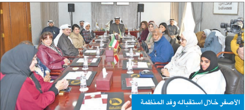
الأصفر خلال استقباله وفد المنظمة

استقبل وفداً من منظمة الصحة العالمية ورئيس وأعضاء «مدينة الشعب»