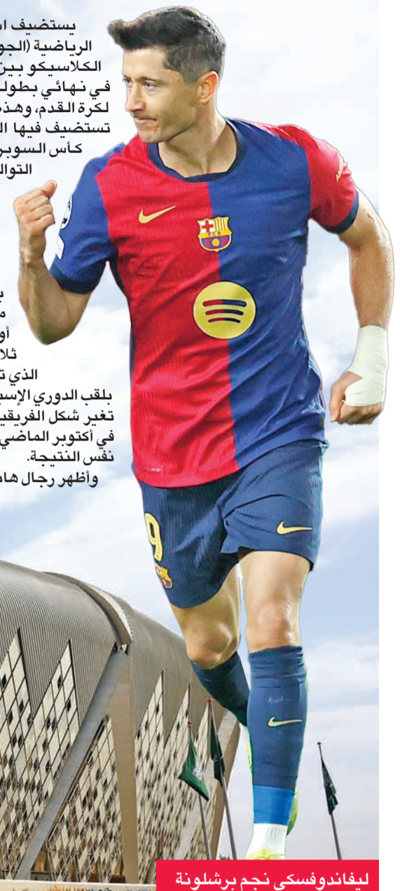
ليفاندوفسكي نجم برشلونه

يستضيف استاد مدينة الملك عبدالله الرياضية (الجوهرة المشعة)، اليوم، مباراة الكلاسيكو بين برشلونه وريال مدريد، في نهائي بطولة كأس السوبر الإسباني لكرة القدم، وهذه هي المرة الخامسة التي تستضيف فيها السعودية منافسات بطولة كأس السوبر الإسباني، والثالثة على التوالي التي تشهد فيها المباراة النهائية لكأس السوبر مواجهة الكلاسيكو، حيث تبادل الفريقان الفوز باللقب في 2023 و2024. ومنذ بدء إقامة البطولة، بمشاركة أربعة فرق بداية من عام 2020، فاز برشلونه أو ريال مدريد باللقب في آخر ثلاث نسخ، مع العلم أن الفريق الذي توج بلقب هذه البطولة توج بلقب الدوري الإسباني بنهاية الموسم، وربما تغير شكل الفريقين عن آخر مرة التقيا فيها في أكتوبر الماضي، لكن برشلونه يأمل تحقيق نفس النتيجة. وأظهر رجال هانسي فليك، مدرب برشلونه،