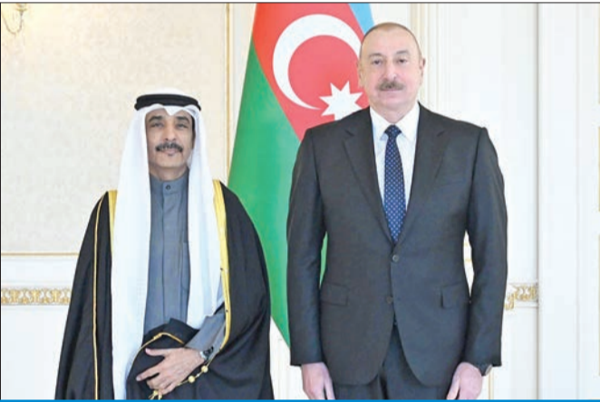
علفيف والمطيري خلال مراسم تقديم أوراق الاعتماد بالقرص الرئاسي في باكو

المطيري قدم أوراق اعتماده إلى علفيف سفيراً للكويت في باكو