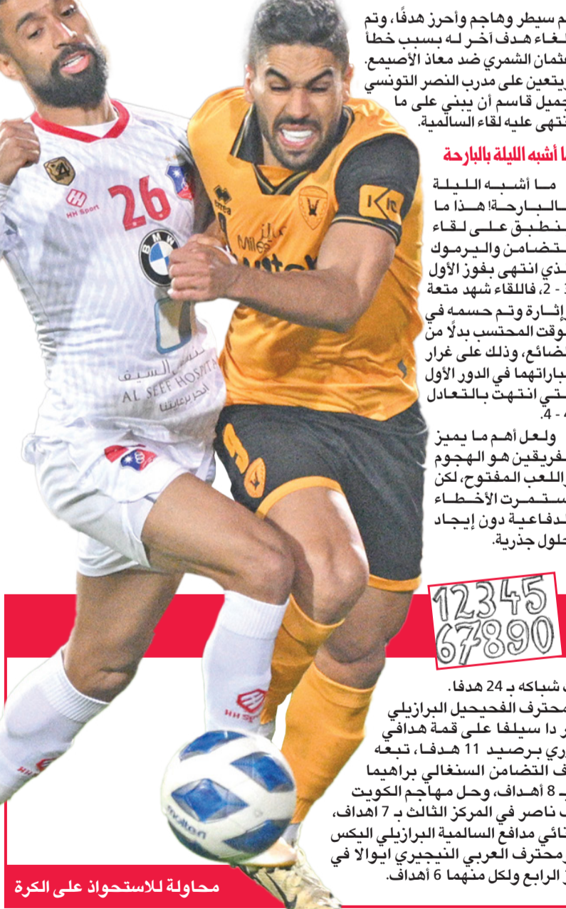
محاولة للاستحواذ على الكرة

وأشار بلقاسم إلى أن المستويات في الدوري الممتاز متقاربة، وهو ما يتطلب الاستعداد لكل المباريات بالقوة المطلوبة.