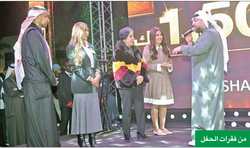
من فقرات الحفل

على الحضور، وبيئت أن المهرجان تخلله العديد من الفعاليات الممتعة والمسابقات وتوزيع الجوائز على الجمهور، كما وجهت الشكر إلى كل من ساهم في إنجاح السحب الكبير لحساب النجمة.