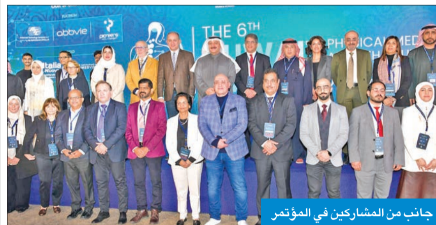
جانب من المشاركين في المؤتمر

أكدت وزارة الصحة أن تخصص الطب الطبيعي والتأهيل الطبي إحدى الركائز الأساسية في منظومة الرعاية الصحية الشاملة، ويعني باستعادة قدرة الإنسان على المشاركة الفعالة في حياته اليومية ومجتمعه. وأوضحت أنه وسط الزيادة الملحوظة في الأمراض المزمنة والإصابات المرتبطة بأنماط الحياة الحديثة أصبح ضروريا إدماج الوقاية والتأهيل الطبي كجزء أساسي من السياسات والاستراتيجيات الصحية الوطنية.