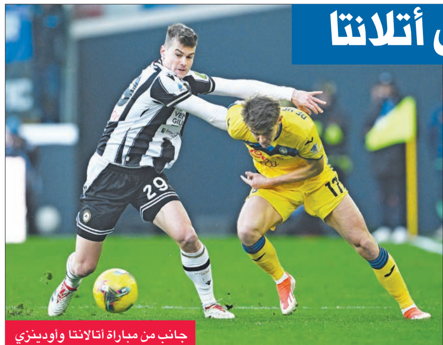
جانب من مباراة أتلانطا وأودينيزي

وتجمد رصيد إيمبولي عند 20 نقطة في المركز الـ14.