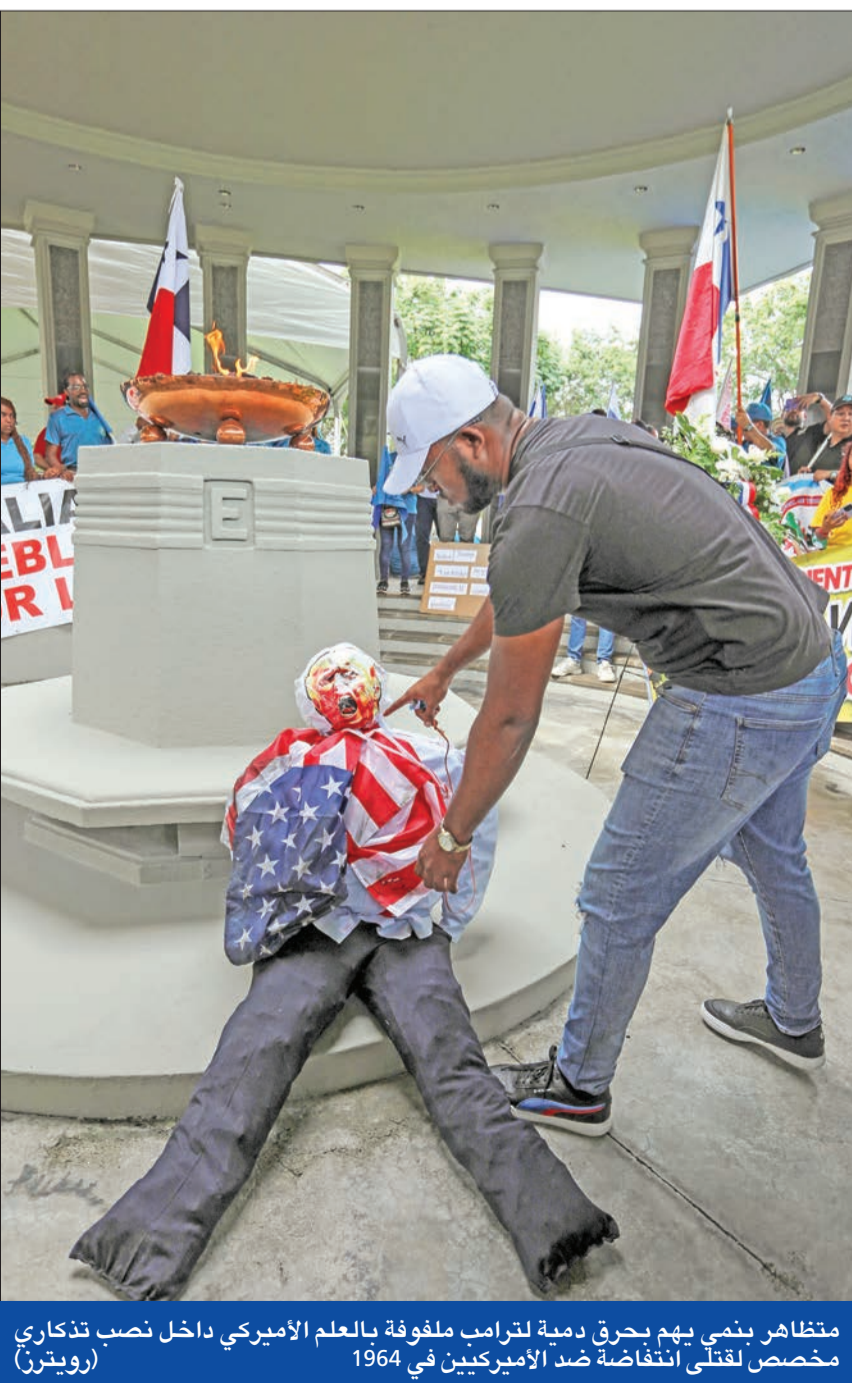
مظاهر بنمي بهم بحرق دمية لترامب ملفوفة بالعلم الأميركي داخل نصب تذكاري مخصص لقتلى انتفاضة ضد الأميركيين في 1964

في تطور يؤكد صحة التقارير الأوكرانية والغربية عن توتر كوريا الشمالية في الحرب الأوكرانية. قال الرئيس الأوكراني فولوديمير زيلينسكي، أمس، إن القوات الأوكرانية أسرت جنديين من كوريا الشمالية، كانا يقفان إلى جانب القوات الروسية في منطقة كورسك الحدودية الروسية. وادلى زيلينسكي بتلك التصريحات، بعد أيام من بدء أوكرانيا شن هجمات جديدة في كورسك، للاحتفاظ بالأراضي التي احتلتها بغارة خافتة في أغسطس، أسفرت عن أول احتلال لأراضٍ روسية منذ الحرب العالمية الثانية. وأسفر الهجوم المضاد الذي شنته موسكو إلى إرهاب القوات الأوكرانية واضعاف معوياتها، مما أسفر عن مقتل وإصابة الآلاف واستعادة أكثر من 40 بالمئة من مساحة منطقة كورسك، التي تبلغ 984 كيلومترا مربعا (380 ميلا مربعا)، التي استولت عليها أوكرانيا. وقال زيلينسكي، في منشور على تطبيق