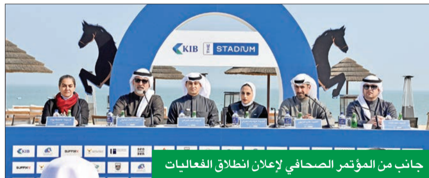
جانب من المؤتمر الصحافي لإعلان انطلاق الفعاليات