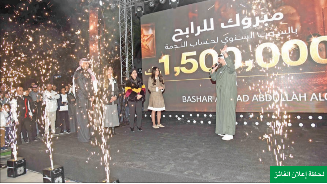
لحظة إعلان الفائز