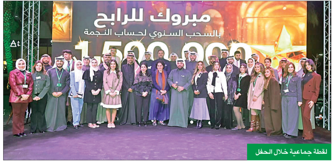
لقطة جماعية خلال الحفل

نظم البنك التجاري فعالية مبتكرة باسم «متحف النجمة»، بمناسبة إجراء السحب على الجائزة الكبرى لحساب النجمة، التي تبلغ قيمتها 1.5 مليون دينار، وأقيم الحدث في مجمع مروج، حيث تم استعراض تاريخ البنك العريق وسعوبات النجمة،