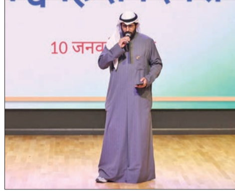
العازمي يؤدي أغنيته