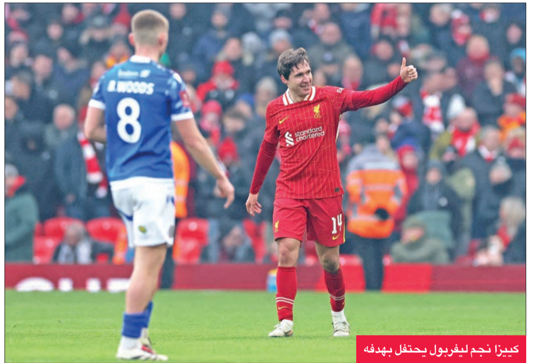
كيزا نجم ليفربول يحتفل بهدفه

وأجبر الحارس على صدة صعبة تابعها دانس في الشباك (76)، وسدد في القائم (87) ثم سجل أول أهدافه مع ليفربول من تسديدة زاحفة من خارج المنطقة (90).