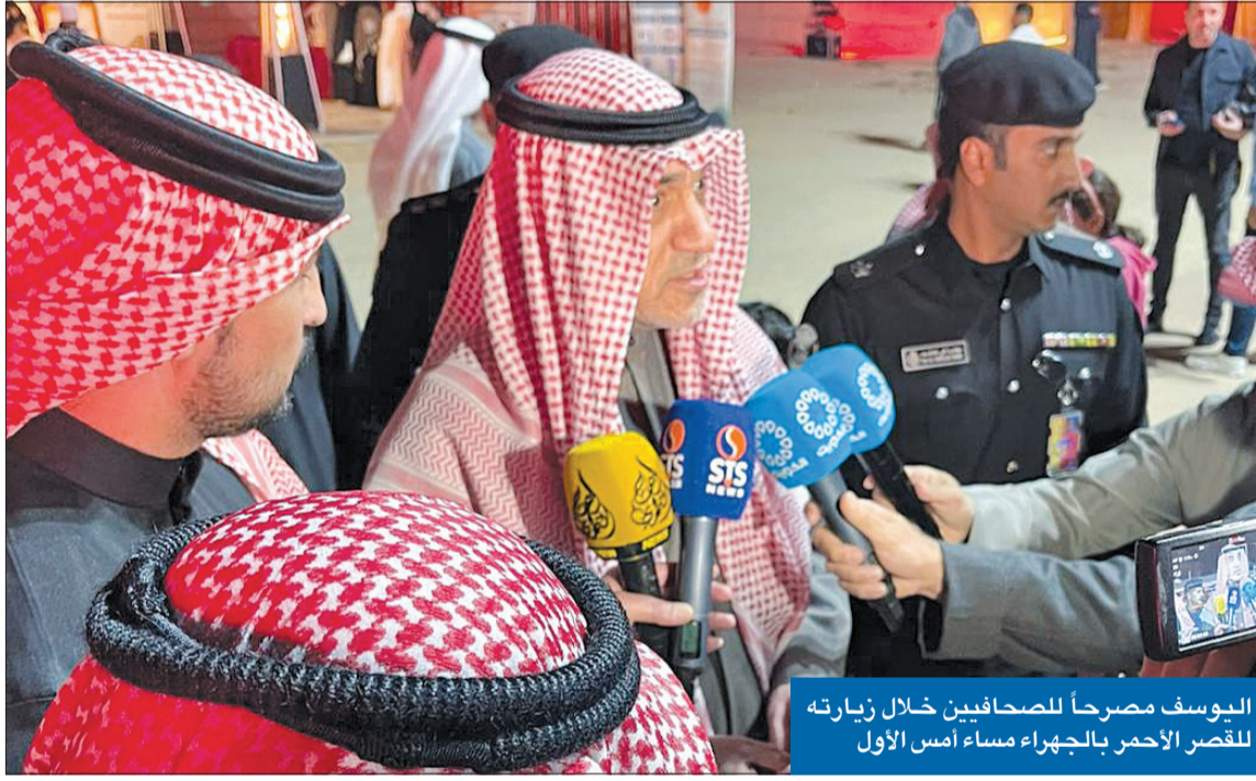
اليوسف مصرحاً للصحافيين خلال زيارته للقصر الأحمر بالجهراء مساء أمس الأول

وأشاد النائب الأول بنشاط محافظ الجهراء وسعيه إلى تطوير كل ما من شأنه جذب السياحة إلى محافظته، لاسيما مع ما تمتلكه من بنية تحتية تؤهلها لهذا الهدف، مبدواً أهالي الجهراء بتحقيق حلمهم عبر إنشاء واجهة بحرية للمحافظة في القريب. وأعرب عن تطلعه إلى إنشاء أكثر من نادٍ رياضي بالجهراء لاسيما بعد توسع حدودها، مضيفاً أن المطلاع مدينة وحدها وتحتاج إلى نادٍ وخدمات خاصة بها، غير أن هذا الأمر يحتاج إلى وقت، «ومع الأسف نحن مستعجلون فقط». وبشر اليوسف المواطنين: «في قادم الأيام سترون في دولة الكويت أكثر مما كنتم تتوقعون وتختلون وتفكرون على صعيد المشاريع والسياحة، لاسيما بعد النجاح الذي تحقق في التنظيم المبهر في (خليجي 26)، غير أننا نحتاج إلى بعض الوقت».