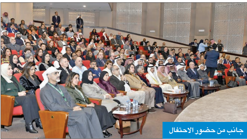
جانب من حضور الاحتفال

حيث إنها تتجاوز الإطار الرسمي لتشمل تبادلًا ثقافيًا وسياحيًا نشطًا، ويشهد على ذلك الإقبال المتزايد للسائح الكويتيين على كندا، لافتاً إلى «استعداد الكويت للتعاون مستقبلاً مع كندا بنفس الروح البناءة التي سادت تلك العلاقات فيما مضى». واستذكر «العرفان والتقدير والدعم السخي الذي قدمته كندا للكويت إبان الغزو العراقي الغاشم، انطلاقاً من إيمانها بقيم الحرية والعدالة».