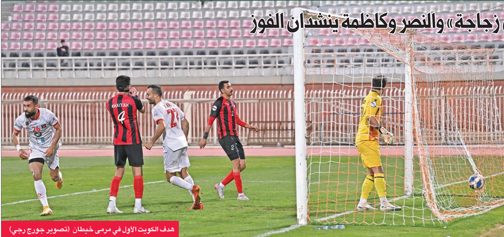
هدف الكويت الأول في مرمى خيطان

ولدى اليرموك لاعبون أكفاء، أبرزهم المغربي أيوب لخصر، والمهاجم عقيل الهيم. أما مواجهة النصر (التاسع بـ5 نقاط)، وكاظمة (السابع بـ10 نقاط)، فعلى غرار العديد من المباريات السابقة تأتي خارج نطاق التوقعات. فهناك تحسن ملموس شهده مستوى النصر في المباريات الأخيرة، آخرها أمام السالمية، رغم الخسارة 2-1، وهو ما يمنح الجهاز الفني الأمل في تحقيق الانتصارات تباعاً. وتشهد مواجهة اليوم مشاركة