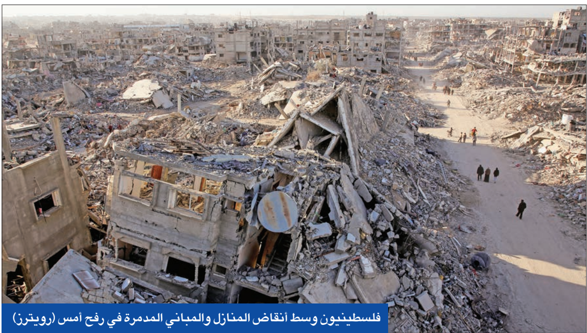
فلسطينيون وسط أنقاض المنازل والمباني المدمرة في رفح أمس

شدد زعيم المعارضة بائير لايبند على أن الحرب انتهت، ويجب تنفيذ صفقة التبادل بالكامل والاستمرار فيها حتى يعود آخر مختطف إلى عائلته. وقال لايبند: «بعد أسوأ عامين في تاريخنا يجب أن تنتهي الحرب ويعود الهدوء إلى حياتنا، وهدفنا إعادة بناء الردع والاقتصاد وليس العودة للحرب».