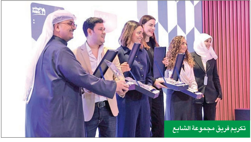
تكريم فريق مجموعة الشايح