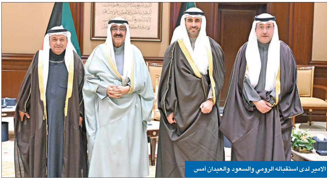
الأمير لدى استقباله الرومي والسعود والعيان أمس

تزامناً مع استقبال سمو أمير البلاد الشيخ مشعل الأحمد، في قصر بيان أمس، وزير النفط طارق الرومي والرئيس التنفيذي لمؤسسة البترول الكويتية الشيخ نواف سعود الناصر، والرئيس التنفيذي لشركة «نفط الكويت» أحمد العيدان، ثم استقبال سمو ولي العهد الشيخ صباح الخالد لهم، أعلنت الشركة اكتشاف كميات تجارية كبيرة من الموارد الهيدروكربونية في حقل الجليعة البحري الواقع بالمياه الإقليمية الكويتية. وذكرت الشركة، في بيان، أن هذه الاكتشافات تأتي في إطار جهودها الاستكشافية المتواصلة لتعزيز مكانة الكويت كمنتج رئيسي للنفط والغاز في المنطقة، وتحقيقاً لاستراتيجية الاستكشاف في المنطقة البحرية الكويتية. وأوضحت أن اختبارات مكمن زبير الجيولوجي «من العصر الطباشيري» في البئر الاستكشافية «جليعة 2» أظهرت مؤشرات إنتاجية مباشرة، إذ يغطي الحقل 74 كيلومتراً مربعاً، وتقدر احتياطياته بنحو 800 مليون برميل من النفط المتوسط الكثافة الخالي من غاز كبريتيد الهيدروجين وبنسبة منخفضة من غاز ثاني أكسيد الكبريت، إضافة إلى 600 مليار قدم مكعبة قياسية من الغاز المصاحب مما يعادل 950 مليون برميل نفط مكافئ. ويعد هذا الاكتشاف يمثل إضافة مهمة للموارد الهيدروكربونية في الكويت ويعزز إمكانات وجود مكامن إضافية في العصر الطباشيري العلوي بالمنطقة البحرية 02