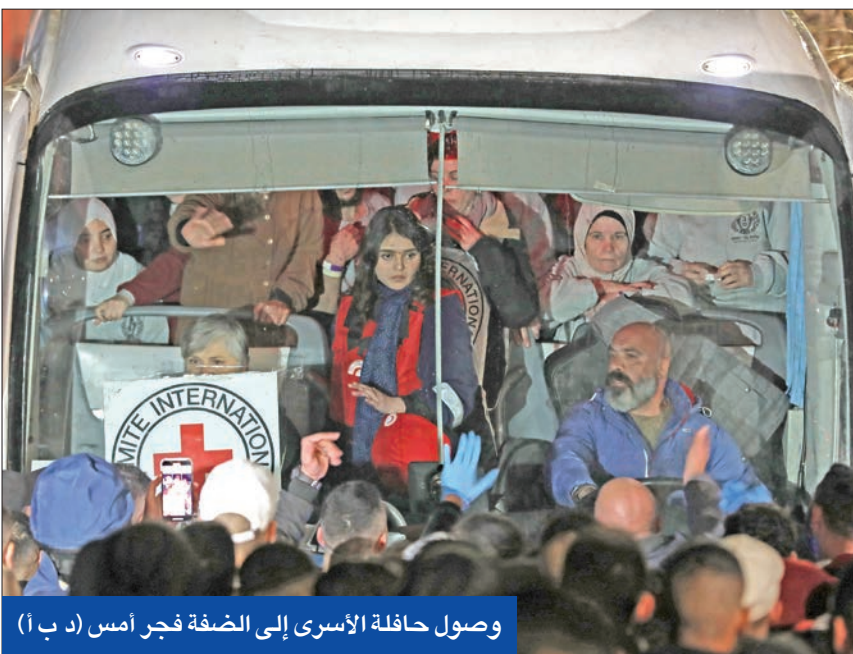
وصول حافلة الأسرى إلى الضفة فجر أمس

شدد زعيم المعارضة بائير لايبند على أن الحرب انتهت، ويجب تنفيذ صفقة التبادل بالكامل والاستمرار فيها حتى يعود آخر مختطف إلى عائلته. وقال لايبند: «بعد أسوأ عامين في تاريخنا يجب أن تنتهي الحرب ويعود الهدوء إلى حياتنا، وهدفنا إعادة بناء الردع والاقتصاد وليس العودة للحرب».