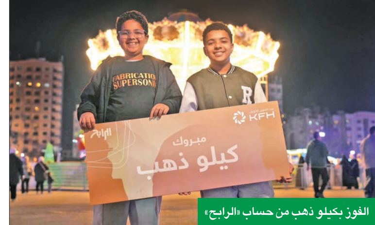
الفوز بكيلو ذهب من حساب «الرابح»