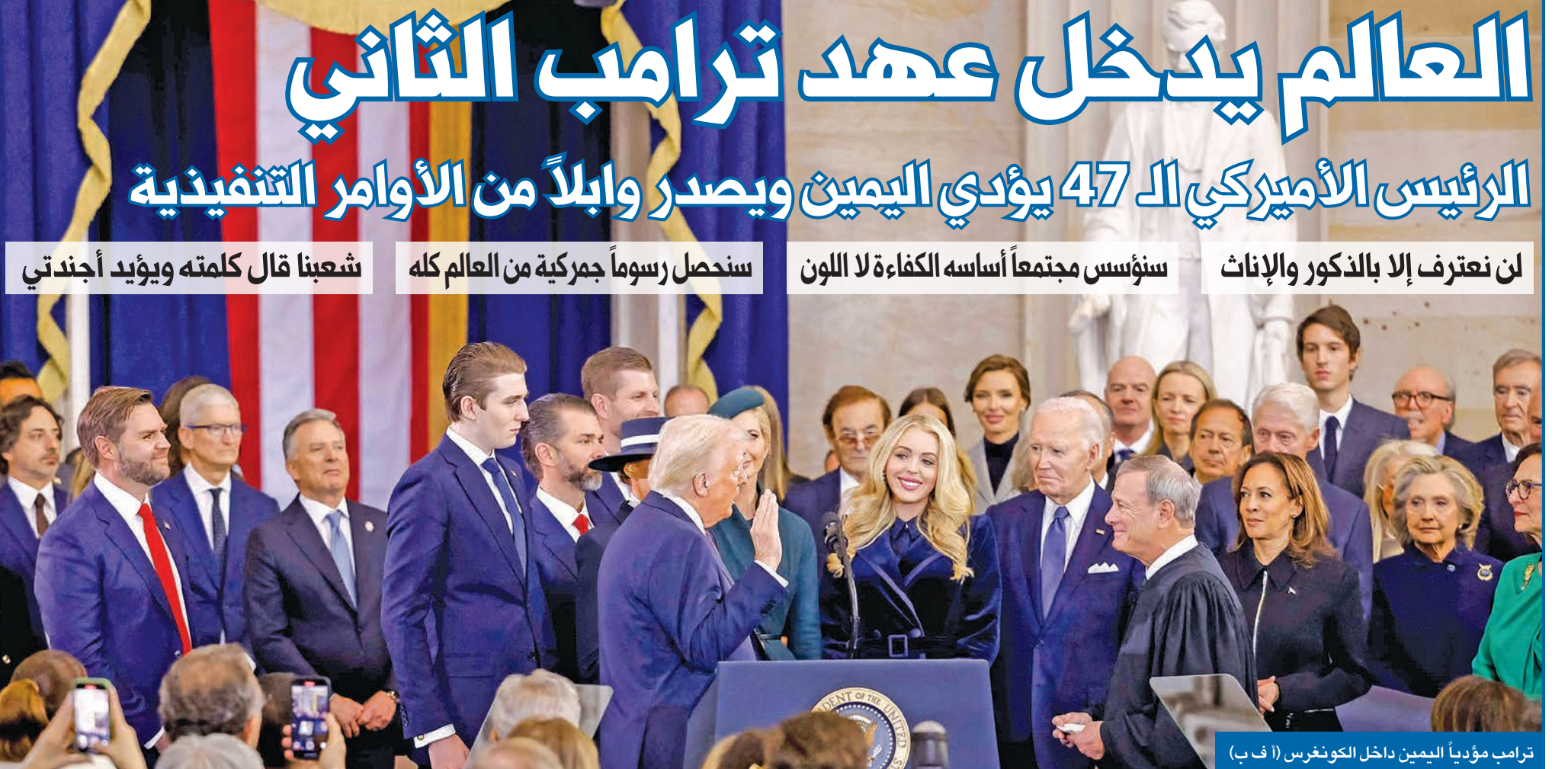
ترامب مؤدياً اليمين داخل الكونغرس