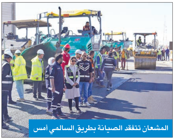
المشعان تفقدت الصيانة بطريق السالمي أمس

صيانة الطرق تأتي ضمن خطة الوزارة الاستراتيجية لتحسين شبكة الطرق، وتوفير بيئة آمنة ومستدامة للمواطنين والمقيمين، بما يواكب التطور العمراني واحتياجات النقل المتزايدة.