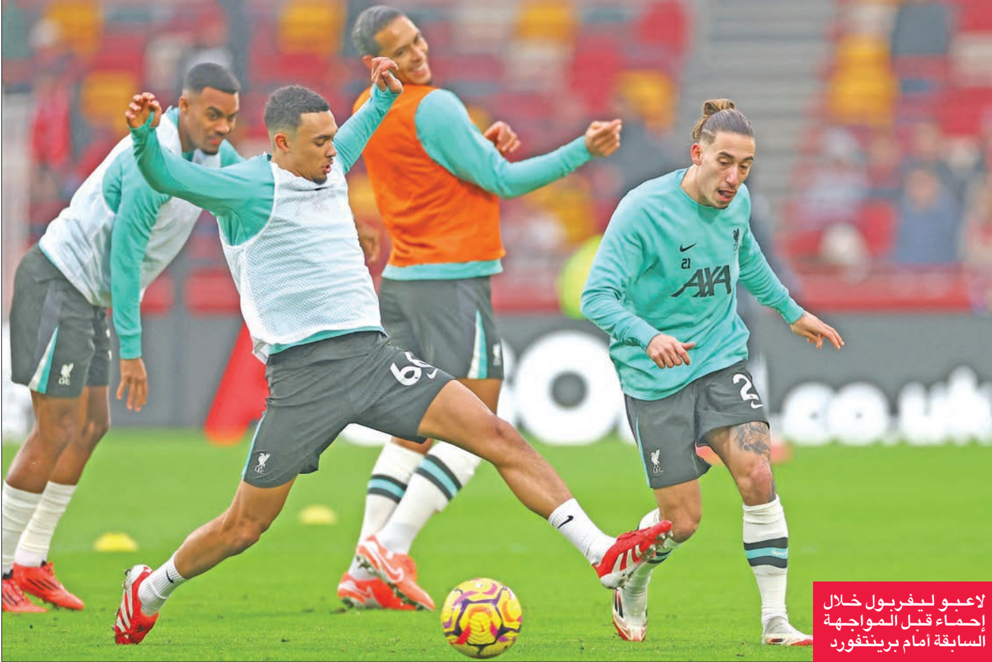
لاعبو ليفربول خلال إحماء قبل مواجهة السابعة أمام برينتفورد

لعب في الدوري الأوروبي. وودعت بالفعل فرق لايبزيغ وسلوفان براتيسلافا ويانغ بويوز منافسات البطولة بعد خسارة مبارياتها الست.