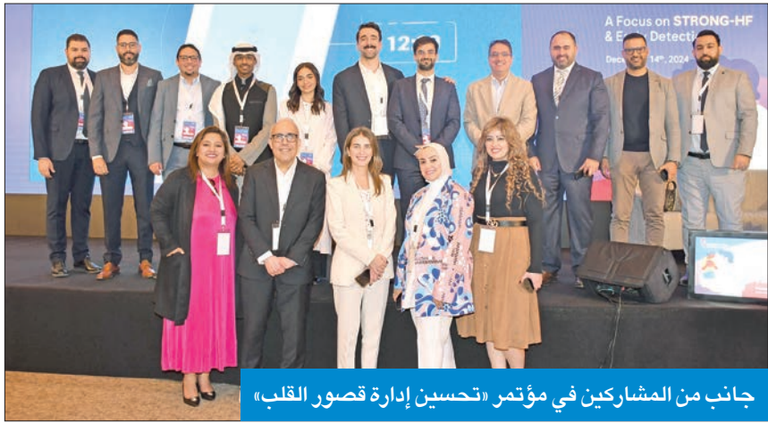
جانب من المشاركين في مؤتمر «تحسين إدارة قصور القلب»

● دراسة صحية أجريت على 10 آلاف حالة في مستشفيات الكويت خلال 18 شهراً ● 60% من مرضى قصور القلب يعانون داء السكري