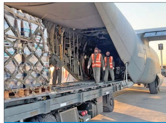
خلال تحميل الطائرة الإغاثية قبيل إقلاعها أمس

وصلت إلى مطار دمشق الدولي، أمس، الطائرة الإغاثية الخامسة من الجسر الجوي الكويتي محملة بـ 10 أطنان من المواد الغذائية والمستلزمات الشتوية للفئات الأكثر احتياجاً في سورية، ضمن حملة «الكويت بجانبكم» بتنظيم من جمعية السلام للأعمال الإنسانية والخيرية.