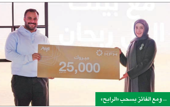
... ومع الفائز بسحب «الرابح»

وحول آلية دخول السحب والشروط الواجب توافرها من العملاء للتأهل للفوز بالجوائز، أوضحت المسلم أنه يجب الاحتفاظ بالرصيد لمدة 15 يوماً لتأهل لدخول السحوبات، حيث يحصل العميل على فرصة واحدة لكل 50 ديناراً، وعند الاحتفاظ بالرصيد لمدة 90 يوماً قبل تاريخ السحب يحصل على فرصتين لكل 50 ديناراً، أما في حال احتفظ العميل بالرصيد لمدة 180 يوماً قبل تاريخ السحب فيحصل على 3 فرص لدخول السحب مقابل كل 50 ديناراً، وسيقوم بيت التمويل الكويتي بإيداع قيمة كل الجوائز في حسابات العملاء. وأكدت المسلم أن «الحصاد» يعتبر إضافة ممتازة لباقة المنتجات المصرفية في بيت التمويل الكويتي، وبمتميزة فرصة مميزة لعملائه، وأحد الأوعية الإخبارية التي تحظى باهتمام وإقبال من العملاء، حيث يتم استثمار أموال العملاء بالكامل في الحساب على أساس الوكالة بالاستثمار. ولفتت إلى أن حساب «الرابح» يأتي