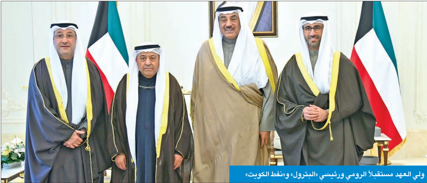
ولي العهد مستقبلاً الرومي ورئيسي «البترول» و«نפט الكويت»

استقبل سمو ولي العهد الشيخ صباح خالد، في قصر بيان ظهر أمس، وزير النفط طارق الرومي، والرئيس التنفيذي لمؤسسة البترول الكويتية، الشيخ نواف السعيد، والرئيس التنفيذي لشركة نفط الكويت، أحمد العيدان.