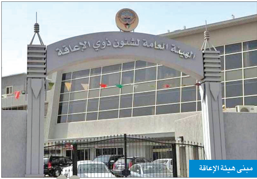
مبنى هيئة الإعاقة

الهيئة ولا تزال تستقبل بعض الحالات الإعاقة، مشيرة إلى أن إجمالي الطلبة المسجلين في هذه الجهات بلغ نحو 13250 طالباً وطالبة في جميع المراحل، كاشفة أن ميزانية القطاع التعليمي للسنة المالية الحالية 2025/2024 بلغت نحو 45 مليون دينار.