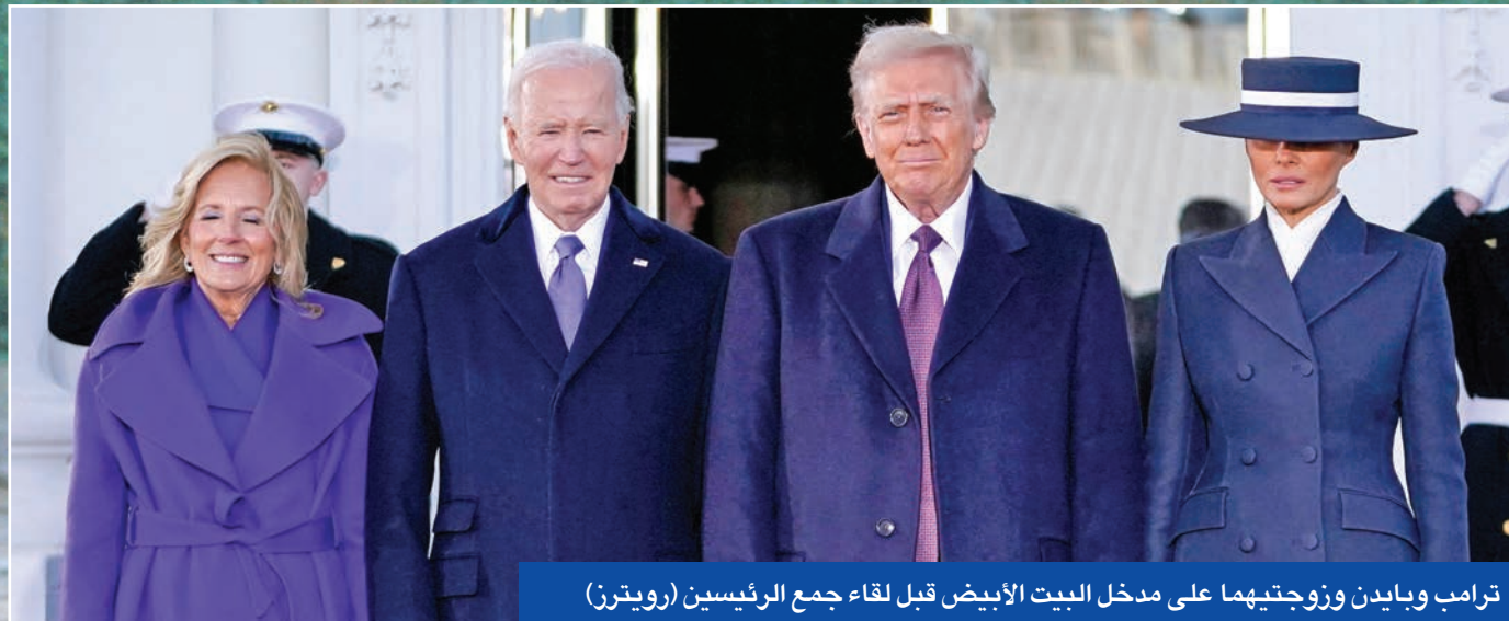
ترامب وبايدن وزوجتهما على مدخل البيت الأبيض قبل لقاء جمع الرئيسين

الرئيس الأميركي يؤدي اليمين: وابل من الأوامر التنفيذية وتعهد بموجة تغيير... وترقب دولي لأخطر 100 يوم