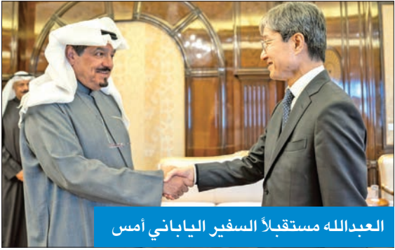
العبدالله مستقبلاً السفير الياباني أمس

استقبل رئيس مجلس الوزراء، سمو الشيخ أحمد العبدالله، في قصر بيان أمس، سفير اليابان لدى الكويت، موكاي كينيتشيرو. وجرى خلال اللقاء استعراض سبل تعزيز أوجه التعاون الثنائي بين البلدين، إضافة إلى تبادل وجهات النظر حيال القضايا ذات الاهتمام المشترك. حضر المقابلة رئيس ديوان رئيس مجلس الوزراء، عبدالعزيز الدخيل.