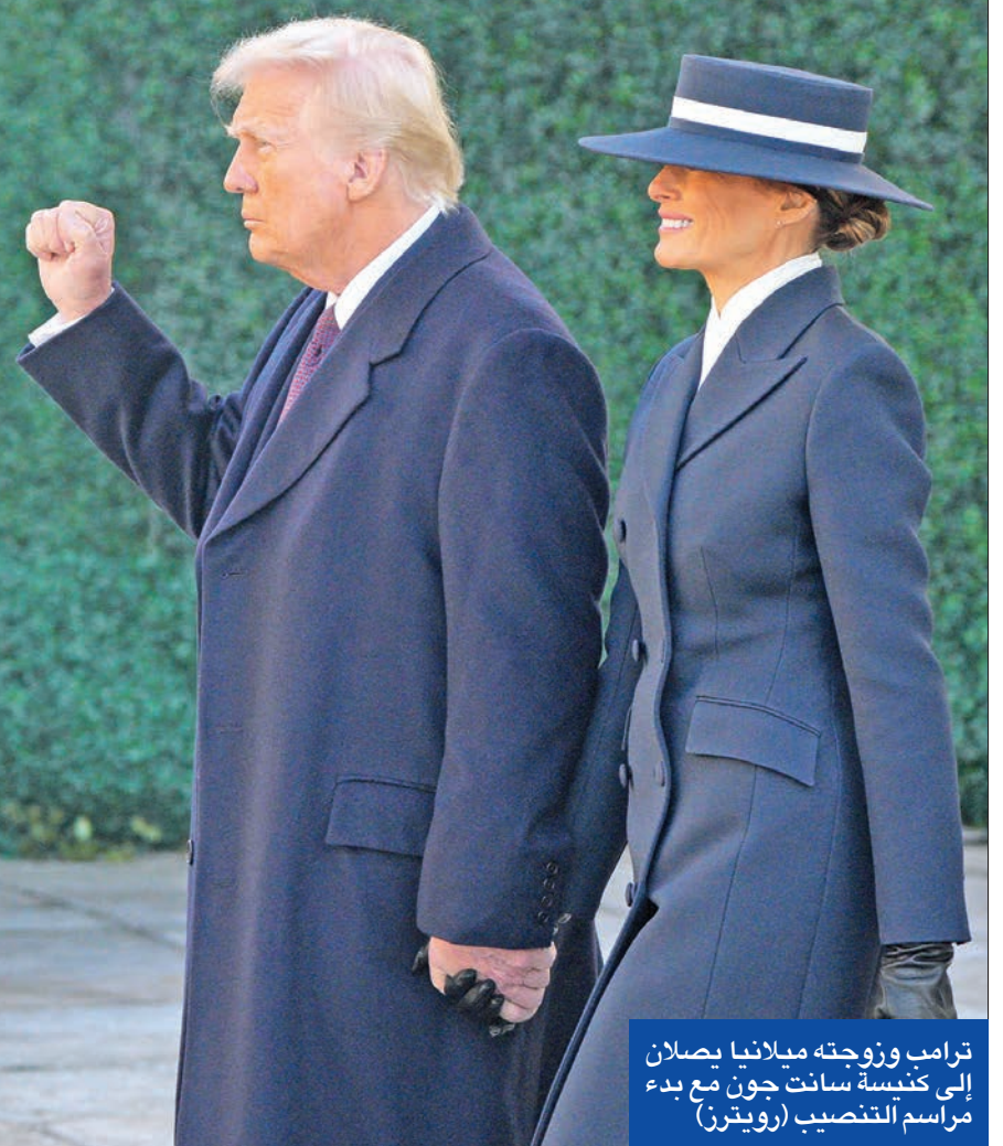
ترامب وزوجته ميلانيا يصلان إلى كنيسة سانت جون مع بدء مراسم التنصيب

الأسبوع الماضي عن توصلهما لاتفاق لوقف إطلاق النار في غزة وحذر ترامب، الذي انضم مبعوثه إلى المفاوضات في قطر، من أن أبواب الحميم ستفتح على مصراعها إذا لم تطلق «حماس» سراح الرهائن قبل تنصيبه. وزعم ترامب خلال حملته الانتخابية أنه سينهي الحرب بين روسيا وأوكرانيا من أول يوم له في المنصب. واستيق الرئيس الروسي فلاديمير بوتين من موسكو لاجتماع مع ترامب في البيت الأبيض، وهو أول لقاء بين الرئيسين منذ تولي ترامب الرئاسة. وقال ترامب إن «الولايات المتحدة ستعمل على إنهاء الحرب في أوكرانيا من أول يوم له في المنصب».