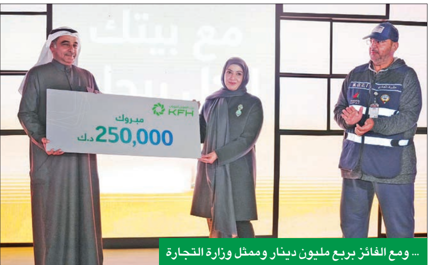
... ومع الفائز بربع مليون دينار وممثل وزارة التجارة