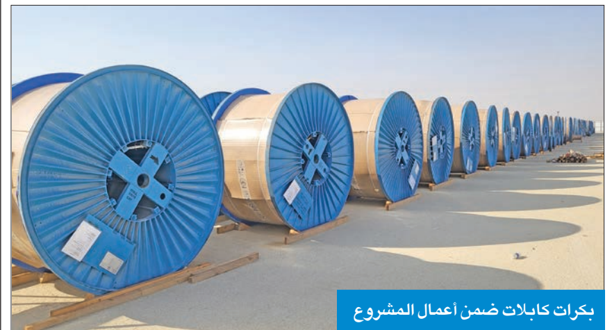
بكرات كابلات ضمن أعمال المشروع

يرفع السعة الاستيعابية الداعمة للشبكة الوطنية بـ 3 آلاف ميغاواط