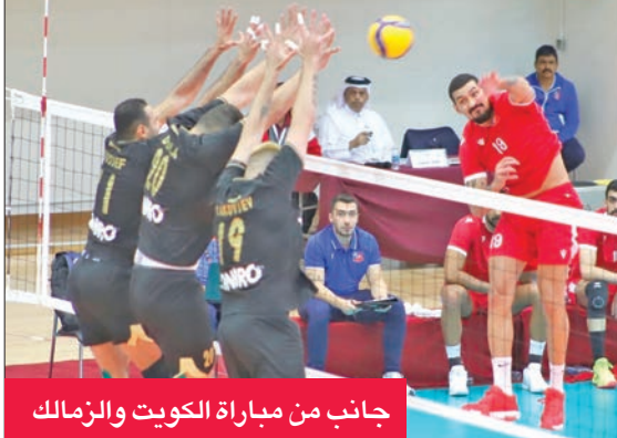
جانب من مباراة الكويت والزمالك

انتزع الفريق الأول لكرة الطائرة بنادي الكويت فوزاً مستحقاً من الزمالك المصري في مباراة ماراثونية امتدت 5 أشواط، وانتهت بنتيجة 3-2، بواقع أشواط 25-22، 25-25، 25-14، 25-23، 15-11، في اللقاء الذي جمع الفريقين أمس الأول على صالة النادي العربي القطري، ضمن الجولة الثانية من المجموعة الثانية بالدور التمهيدي للنسخة الـ43 للبطولة العربية للنادية للرجال، والتي شهدت أيضاً فوز السبب العماني على الهلال الليبي بثلاثة أشواط مقابل لا شيء، كما أسفرت نتيجة مبارياتي المجموعة الثالثة على بطاقتي التأهل لدور الثمانية في المصري على اربيل العراقي 3 - 1، والشرطة القطري على دار كلب البحريني 3 - 0. وبذلك حافظ الكويت على قمة مجموعته الثانية برصيد 5 نقاط، يليه الزمالك ثانياً بـ4 نقاط، ثم السبب بـ3 نقاط، وتتنافس الفرق الثلاثة على بطاقتي التأهل لدور الثمانية في البطولة، بينما فقد الهلال الليبي فرصة المنافسة والصعود. الجدير بالذكر أن فريق نادي الكويت لعب المباراة الأخيرة في المجموعة أمام السبب العماني في ساعة متأخرة من مساء أمس.