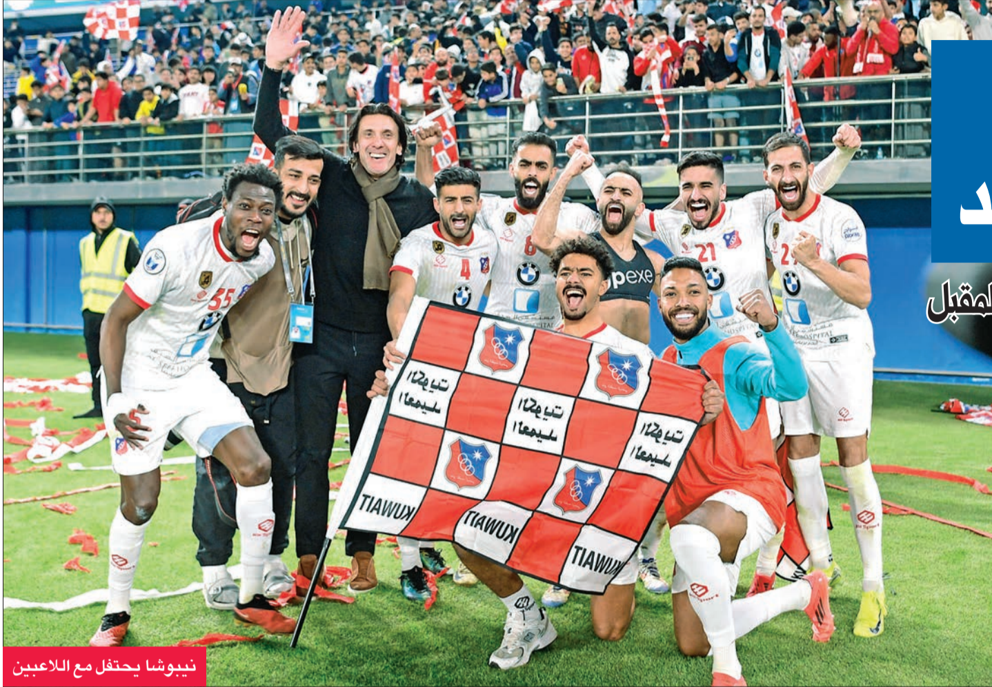
نيوشا يحتفل مع اللاعبين