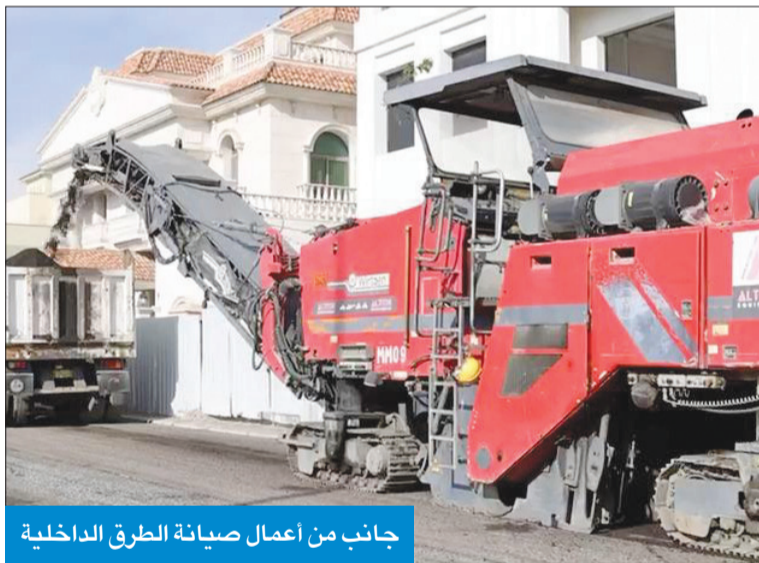
جانب من أعمال صيانة الطرق الداخلية

وذكرت «الداخلية»، في بيان صحفي، أنه بالتعاون مع التطبيق الحكومي الموحد للخدمات الإلكترونية (سهل)، سيتم إرسال إشعارات للمواطنين والمقيمين، تتضمن تفاصيل مواقع أعمال الصيانة والتجهيزات المتعلقة بها، مضافة أنه سيتم توزيع منشورات