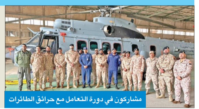
مشاركون في دورة التعامل مع حرائق الطائرات