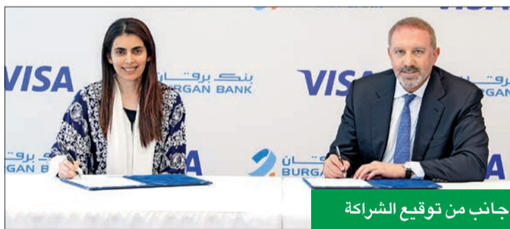
جانب من توقيع الشراكة

في إطار التزام البنك بتوفير حلول مالية مبتكرة للعملاء