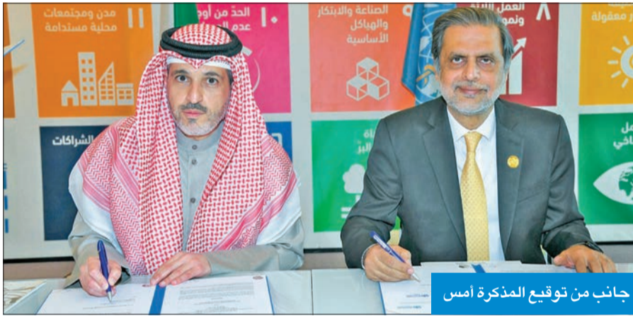
جانب من توقيع المذكرة امس

من جانب آخر، دعت عمادة القبول والتسجيل بـ «التطبيقي»، المقبولين في الكليات التالية: «التربية الأساسية، والدراسات التجارية، والدراسات التكنولوجية، والعلوم الصحية» إلى إجراء اختبار تحديد مستوى اللغة الإنكليزية، منبهة الطلبة إلى ضرورة الدخول على حساباتهم الشخصية الرسمية في الهيئة لمعرفة تاريخ الاختبار ووقته ومكانه، وأنه لن يتم إدخال أي طالب إلا وفق الموعد المحدد له، فضلاً عن إحضار بطاقتهم المدنية خلال وقت الاختبار.