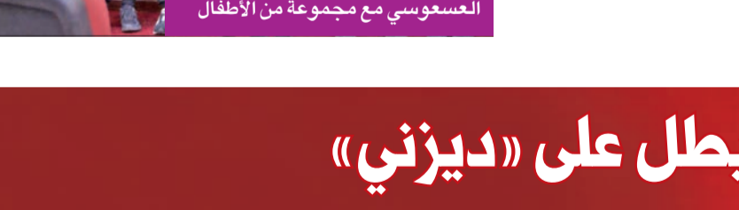
العسوس مع مجموعة من الأطفال