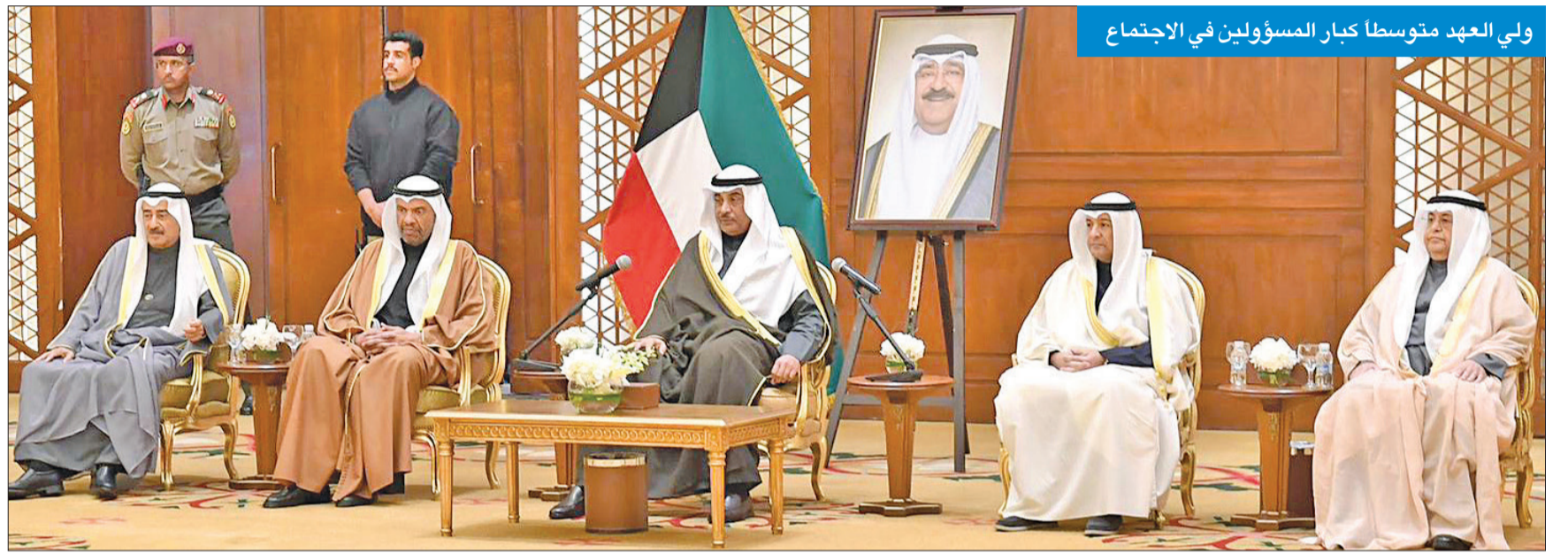
ولي العهد متوسلاً كبار المسؤولين في الاجتماع