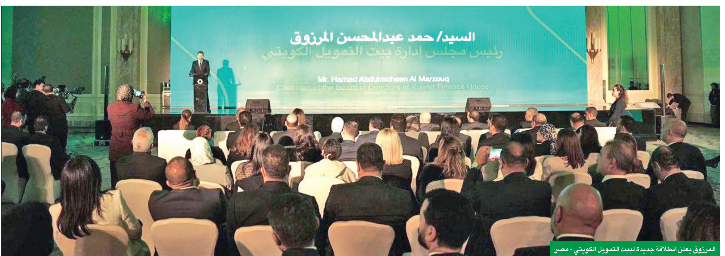
المرزوق يعلن انطلاقاً جديدة لبيت التمويل الكويتي - مصر