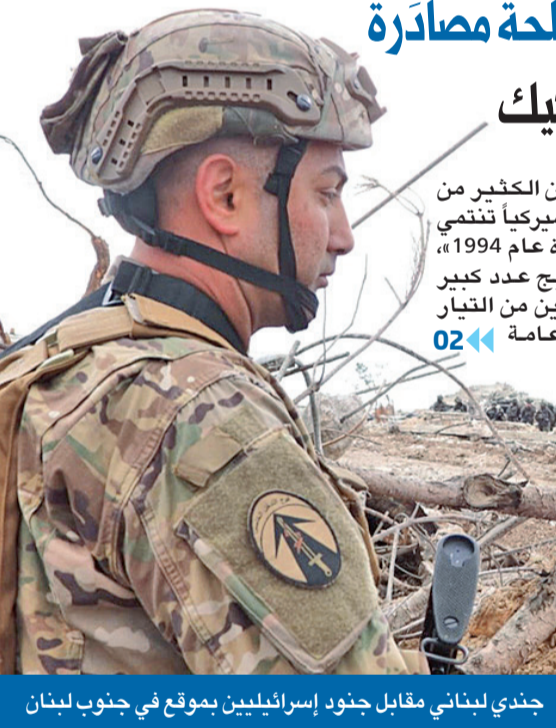
جندي لبناني مقابل جنود إسرائيليين بموقع في جنوب لبنان

• نشر فيديو يُظهر جنود الجيش داخل منشأة صاروخية للحزب رداً على التشكيك