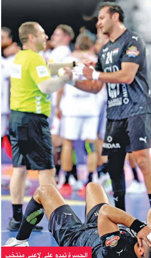
الحسرة تبدو على لاعبي منتخب مصر بعد الخسارة (أ ف ب)

وكان المنتخب الوطني الأول لكرة اليد احتل المركز الـ 27 في المونديال، بعد فوزه على اليابان الذي اكتفى بالمركز 28 بنتيجة 37 - 32، وذهب المركز الـ 25 لبولندا بفوزها على أميركا 26 - 21، برميات الجزء 3 - 1، بعد التعادل في الوقت الأصلي 21 - 21، وجاء المركز الـ 29 من نصيب البحرين، بعد فوزها 29 - 26 على الجزائر، الذي حصل على المركز الـ 30، يليه منتخب غينيا 31 بعد فوزه على كوبا الـ 32 والأخير برميات الجزء 5 - 3، بعد تعادلهما في الوقت الأصلي 28 - 28.