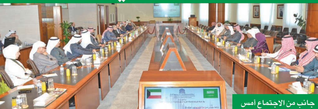
جانب من الاجتماع أمس

التعاون والشراكة الاقتصادية بينهما، وتحقيق التكامل بين الفرص المتاحة في البلدين، واستكشاف وتطوير الفرص الاقتصادية في ضوء رؤية المملكة 2030 والكويت 2035، مما يؤثر بان الأفاق غير محدود للتعاون والشراكات.