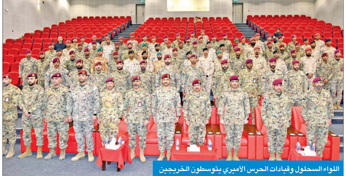
اللواء السحلول وقيادات الحرس الأميري يتوسطون الخريجين

احتفل معهد تدريب الحرس الأميري، أمس، بتخريج دورة أمن وحماية الشخصيات المشتركة رقم 79، بمشاركة منتسبين من مملكة البحرين الشقيقة،