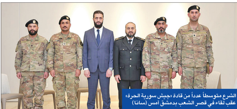
الشرع متوسطاً عدداً من قادة «جيش سورية الحرّة» عقب لقاء في قصر الشعب بدمشق أمس (سانا)

إضافة إلى إنشاء مهبط لطائرات الهليكوبتر بالمنطقة الاستراتيجية التي تطل على الحدود السورية-اللبنانية. إلى ذلك، ذكرت تقارير أن المفاوضات بين قنات سورية الديمقراطية (قسد) والإدارة السورية وصلت إلى منعطف خطير، وقد تتجه الأمور نحو المزيد من التصعيد بين الجانبين، في ظل حديث دمشق عن «مطالب تجيزية»، من القوات الكردية التي تعتمد عليها الولايات المتحدة في محاربة «داعش»، وتضعف تركيا لحلها بالكامل. في سياق قريب، أعلن تنظيم