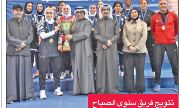
تتويج فريق سلوى الصباح