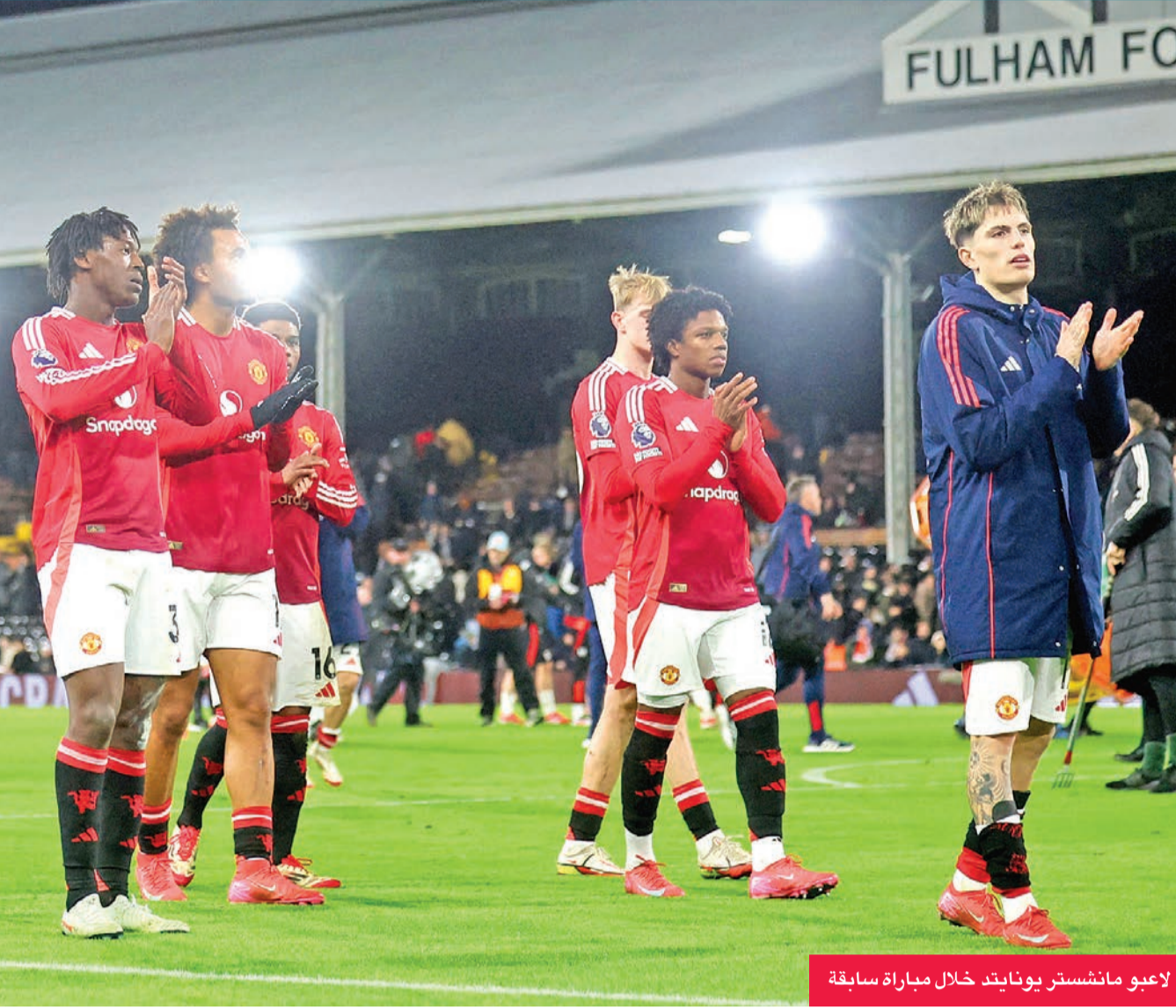
لاعبو مانشستر يونايتد خلال مباراة سابقة

يرصد مانشستر يونايتد وتوتنهام الإنكليزيان التأهل المباشر لثمن نهائي مسابقة (يوروبا ليغ) عندما يخوضان الجولة الـ8 الأخيرة اليوم، الأول أمام ضيفه ستيفو بوخارست الروماني، والثاني أمام ضيفه الفسبورغ السويدي. وحجز لاتسيو الإيطالي البطاقة الأولى لثمن نهائي المسابقة بنظامها الجديد الذي على غرار مسابقة دوري أبطال أوروبا يخول للثمانية الأوائل التأهل المباشر، في حين تلعب الفرق من المراكز الـ9 إلى الـ24 ملحقاً من مباراتين (ذهاباً وإياباً). ويتصدر لاتسيو برصيد 19 نقطة بفارق ثلاث نقاط أمام أينتراخت فرانكفورت الألماني وأتلتيك بلباو الإسباني، في حين يحتل مانشستر يونايتد المركز الرابع برصيد 15 نقطة بفارق نقطة واحدة أمام توتنهام الذي يتفادس المركز الخامس مع ليون الفرنسي وأندلخت البلجيكي وأف سي أس بي (ستيفو بوخارست سابقاً). ويعاني العملاق مانشستر يونايتد في النصف السفلي من جدول ترتيب الدوري الإنكليزي ولكنه بين الثمانية الهبوط.