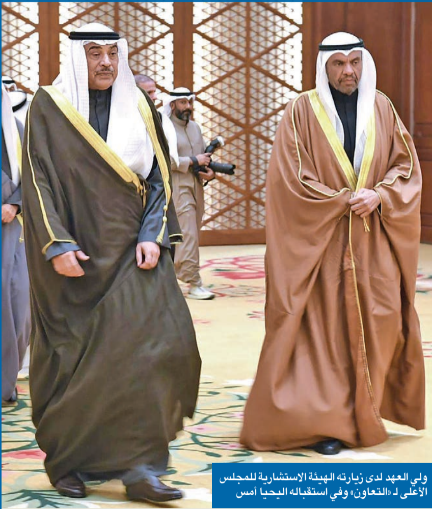
ولي العهد لدى زيارته الهيئة الاستشارية للمجلس الأعلى لـ «التعاون» وفي استقباله يحييا أمس