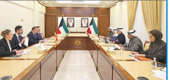
الجابر وشاينا يتراسان المشاورات

انطلاق الجولة الرابعة من المشاورات السياسية