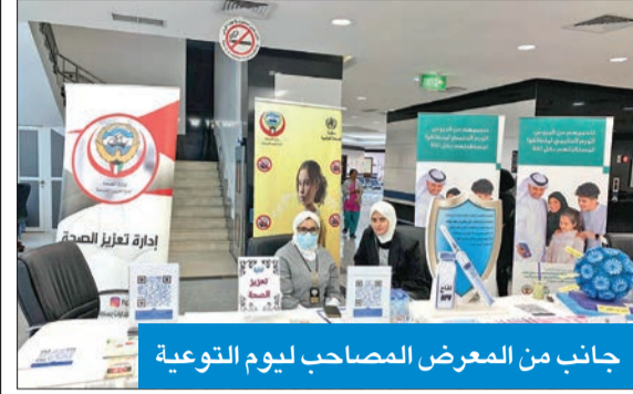
جانب من المعرض المصاحب ليوم التوعية