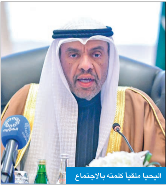
اليحيا ملقياً كلمته بالاجتماع

وزير الخارجية: رؤية خليجية موحدة لمواجهة التحديات والتحويلات الإقليمية والدولية