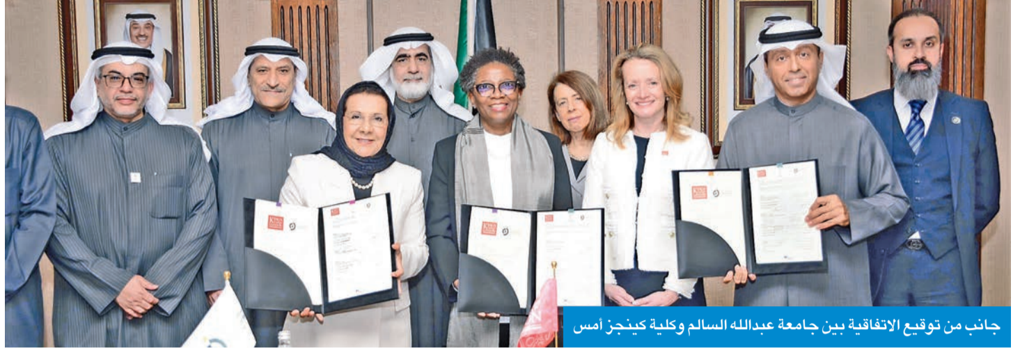
جانب من توقيع الاتفاقية بين جامعة عبدالله السالم وكلية كينجز امس

الجامعة: خطوة نوعية تعكس التزامنا بتقديم تعليم مبتكر عالي الجودة