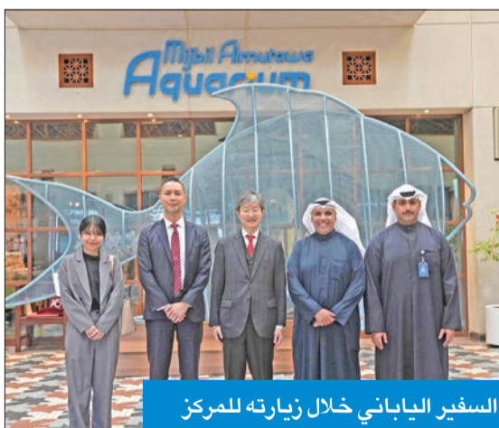
السفير الياباني خلال زيارته للمركز

يتطلع إلى استكشاف فرص جديدة للتعاون مع المؤسسات اليابانية. من جهته، أعرب السفير الياباني عن تقديره للجهود التي يبذلها المركز العلمي في تقديم برامج تعليمية متطورة وتعزيز الوعي البيئي، وأكد أهمية التعاون المستقبلي بين المركز والمؤسسات اليابانية في مجالات التعليم المستدام والابتكار. وشدد الطرفان على أهمية استمرار الحوار والعمل المشترك لتحقيق الأهداف المشتركة، مع تأكيد دور «العلمي» كمركز تفاعلي يسهم في دعم الابتكار ونشر الوعي العلمي والبيئي في المجتمع.