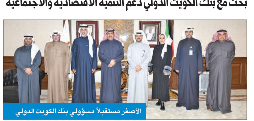
الأصفر مستقبلاً مسؤولي بنك الكويت الدولي

بحث مع بنك الكويت الدولي دعم التنمية الاقتصادية والاجتماعية