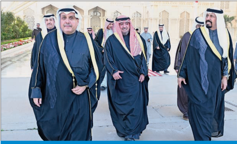
حمد الجابر والوفد المرافق أمس خلال التوجه إلى السعودية لتقديم العزاء

قدم ممثل صاحب السمو أمير البلاد الشيخ مشعل الأحمد، وسمو ولي العهد الشيخ صباح الخالد، الشيخ حمد الجابر، أمس، واجب العزاء إلى أسرة المغفور له بإذن الله تعالى، الأمير محمد بن فهد، طيب الله ثراه وجعل الجنة مثواه، وذلك في العاصمة السعودية الرياض. وضم الوفد الرسمي كلا من الشيخ علي الخالد، والشيخ ناصر العلي، والشيخ د. أحمد ناصر المحمد، ووزير شؤون الديوان الأميري الشيخ محمد العبدالله، والشيخ مشعل الجابر، والشيخ عبدالله الناصر، ومحافظ الأحمدني الشيخ حمود الجابر، والشيخ فراس السعود، والشيخ طلال مشعل الأحمد.