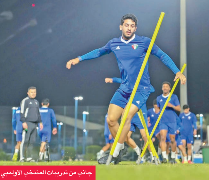
جانب من تدريبات المنتخب الأولمبي

معربا عن أمنيته بالتوفيق للمنتخب الأولمبي الذي يضم بين صفوفه لاعبين موهوبين لهم مستقبل باهر.