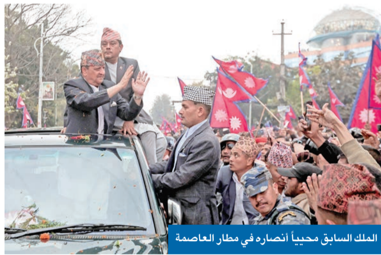
الملك السابق محياً أنصاره في مطار العاصمة

استقبل الآلاف المؤيدين ملك نيبال السابق بحفاوة في العاصمة كاتماندو، وطالبوا بعودة نظامه الملكي الذي تم إلغاؤه، وإعادة الهندوسية ديناً للدولة. وقام نحو 10 آلاف من أنصار الملك جيانيندرا شاه، الأحد، بإغلاق المدخل الرئيسي لمطار تريبهوفان الدولي في كاتماندو، وذلك لدى عودته من جولة بغرب نيبال.