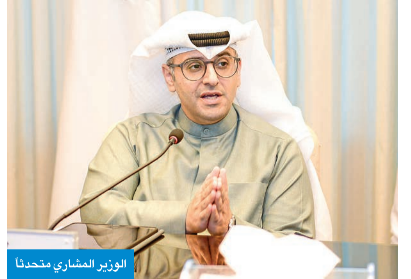
الوزير المشاري متحدثاً

الخبران، الصابرية، حيث سيتم تدشين التصميم والمخططات الأولية للبنية التحتية الرئيسية لهذه المناطق، التي تضم 150 ألف وحدة سكنية.