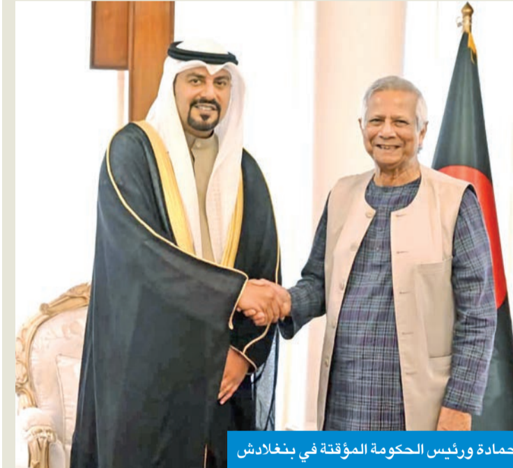
حمادة ورئيس الحكومة المؤقتة في بنغلادش

بحث سفير دولة الكويت لدى بنغلادش، علي حمادة، أمس الأول، سبل تعزيز العلاقات الثنائية بين البلدين في مجالات الدبلوماسية والتجارة والاقتصاد خلال زيارته لرئيس الحكومة المؤقتة في بنغلادش محمد بونس. وذكرت سفارة الكويت لدى بنغلادش أن الجانبين اكدوا خلال اللقاء التزامهما بتطوير العلاقات بين البلدين في عدة مجالات حيوية، بالإضافة إلى التركيز على مجال الاستثمار والطاقة والأمن الغذائي والعملية.