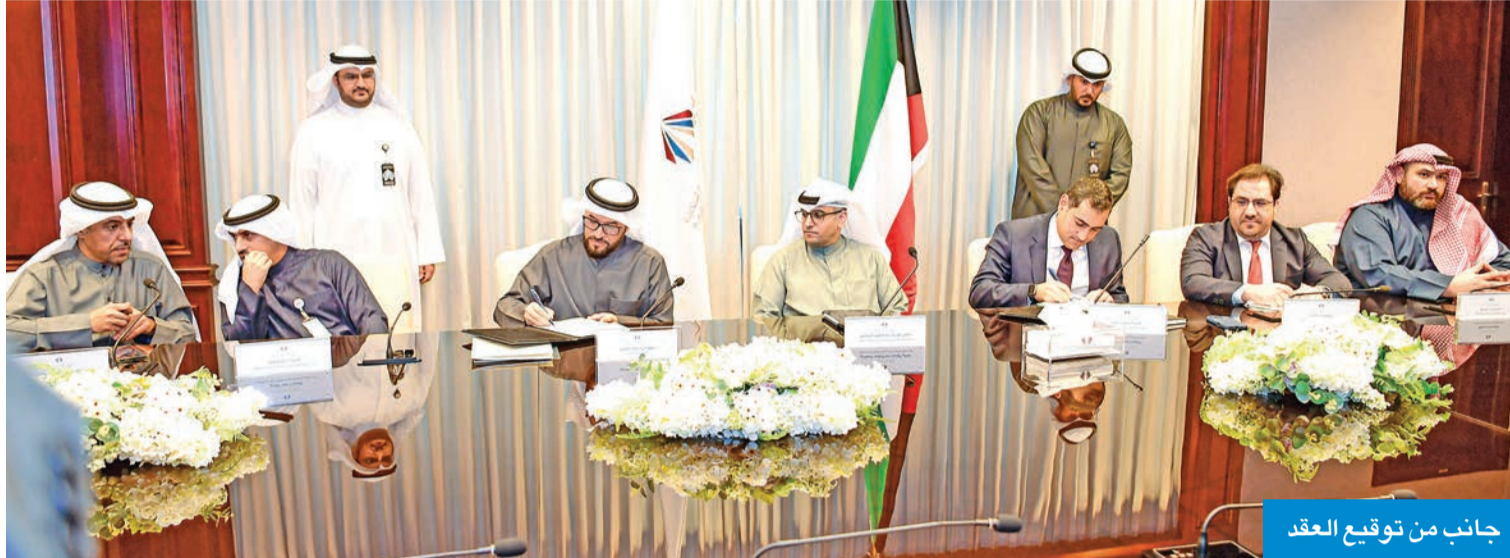
جانب من توقيع العقد