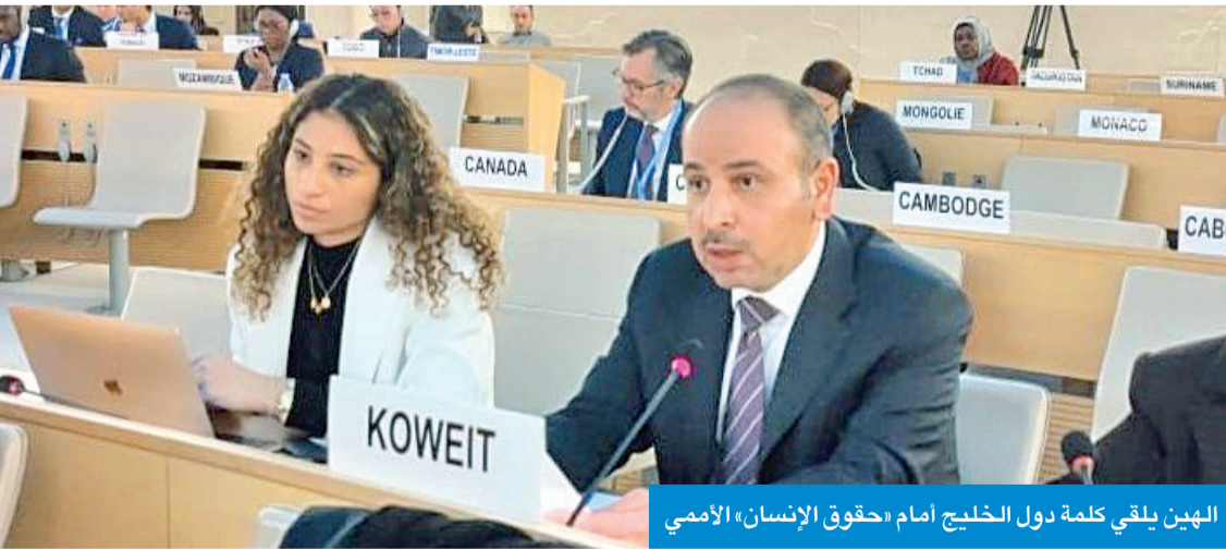
الهيئ يلقي كلمة دول الخليج امام «حقوق الإنسان» الأممي

وأوضح الهيئ أن هذه المبادرات أسهمت في تقلد النساء والفتيات الخليجيات مناصب بارزة خلال السنوات الأخيرة ما مكّنهن من الإسهام الفاعل في المجالات الثقافية والسياسية والعلمية على المستويين الوطني والدولي».