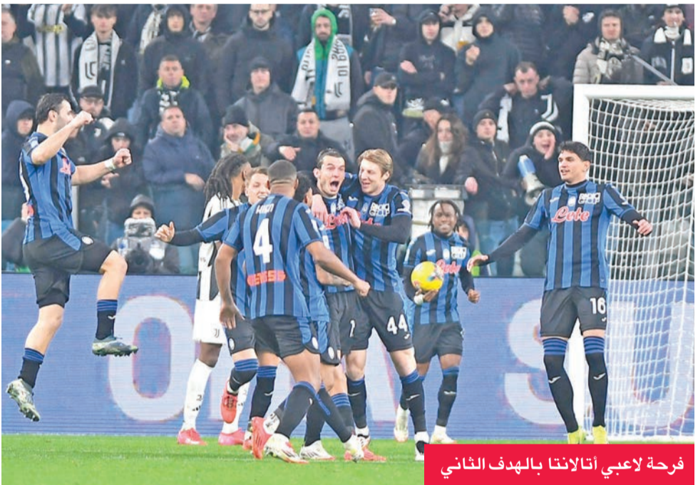
فرحة لاعبي أتالانتا بالهدف الثاني