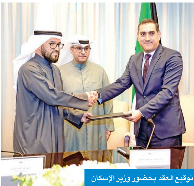
توقيع العقد بحضور وزير الإسكان

وأضاف أن مجلس إدارة المؤسسة العامة للرعاية السكنية جزء من هذا النجاح، إذ إن قرارات المؤسسة ليست فردية، بل تتم دراستها من قبل مجلس الإدارة، الذي وافق على تفعيل 3 مناطق سكنية رئيسية: نواف الأحمد،