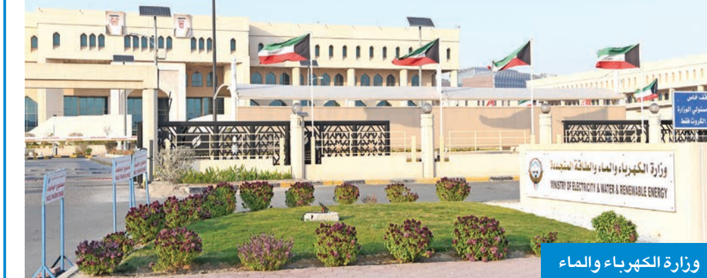
وزارة الكهرباء والماء

للمناقصات بشأن مناقصة استشاري محطة النويصيب (المرحلة الأولى)، تمهيداً لتحديد موعد لترحها.