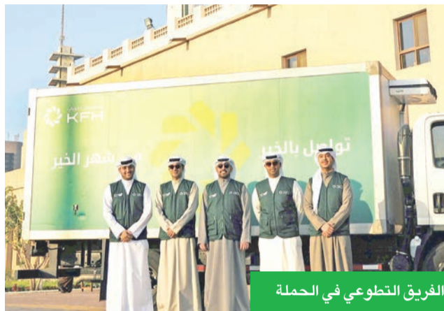
الفريق التطوعي في الحملة

ضمن حملته الرمضانية «تواصل بالخير في شهر الخير»