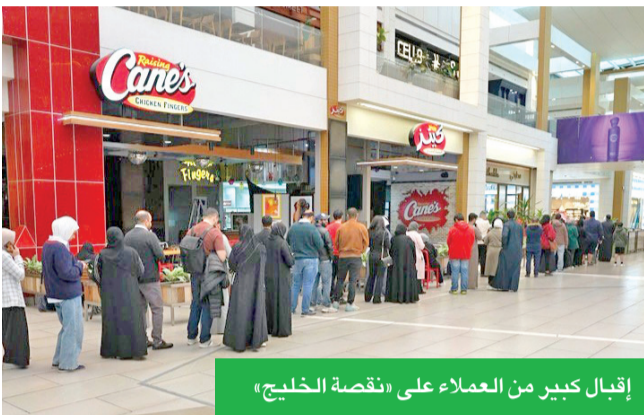
إقبال كبير من العملاء على «نقصة الخليج»

والتوسع، الأمر الذي ينعكس إيجاباً على الاقتصاد الوطني بشكل عام. ويؤكد البنك التزامه بمواصلة جهوده على تعزيز معايير الاستدامة في المجتمع، على المستويات المجتمعية والاقتصادية والبيئية، عبر العديد من المبادرات التي يتم انتقاؤها بعناية لتعود بالنفع على «الخليج» والمجتمع، بما يتوافق مع أهداف الأمم المتحدة للتنمية المستدامة ورؤية الكويت 2035.