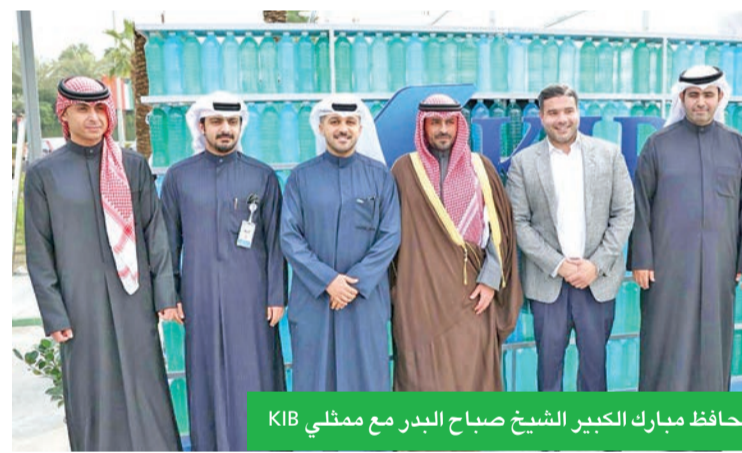
محافظ مبارك الكبير الشيخ صباح البدر مع ممثلي KIB

مفهوم الاستدامة، كما واصل البنك جهوده التوعوية، عبر تعريف الزوار بحقوقهم وواجباتهم المالية، في إطار دعمه المستمر لحملة التوعية الوطنية «لنكن على دراية»، كذلك، شكّلت الفعالية فرصة مهمة للبنك لتعزيز التواصل ويبحث فرص التعاون مع مختلف الجهات لدفع عجلة الاستدامة في الكويت.