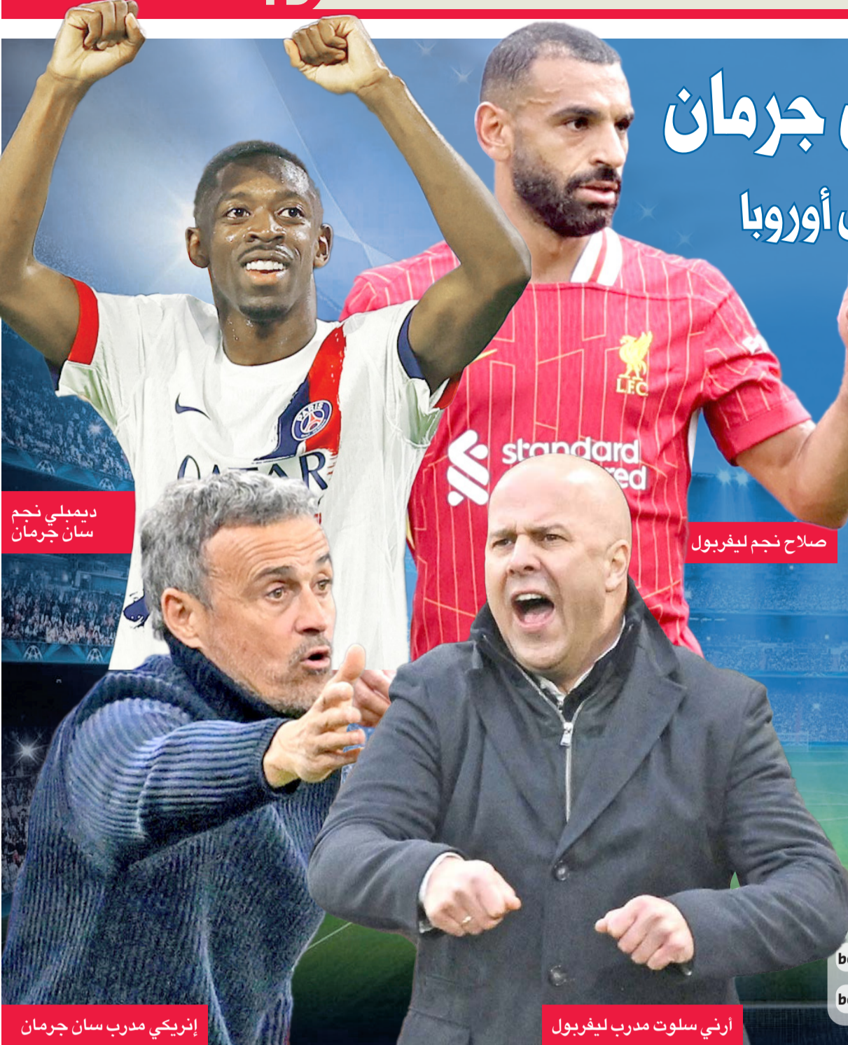
ديمبلي نجم سان جرمان