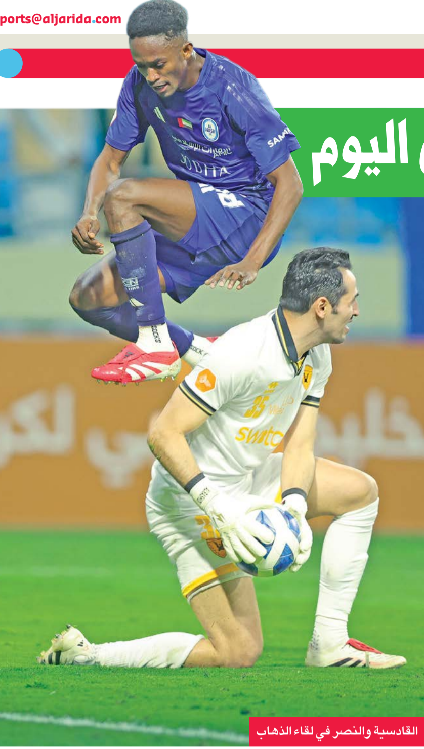
القادسية والنصر في لقاء الذهاب