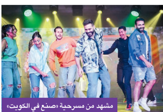
مشهد من مسرحية «صنع في الكويت»