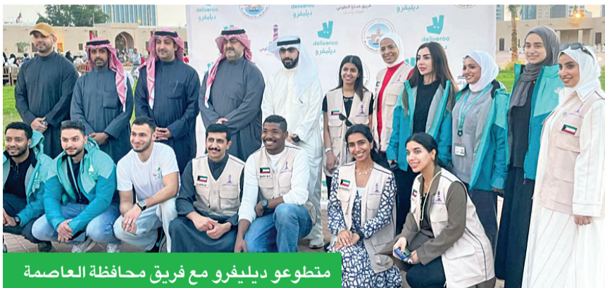
منتوعو ديليفرو مع فريق محافظة العاصمة

المبادرة، تسعى لإحداث تأثير إيجابي يضمن لألاس المحتاجة فرصة مشاركة وجبة دافئة وتجربة روح رمضان الحقيقية المتمثلة في العطاء والتأزر والأمل. وتعد حملة «حياة متكاملة» إحدى الركائز الأساسية لاستراتيجية ديليفرو العالمية في مجال البيئة والمجتمع والحوكمة (ESG). وأطلقت المبادرة لأول مرة في المملكة المتحدة عام 2021، بهدف مكافحة انعدام الأمن الغذائي ودعم المجتمعات المحلية في مختلف أسواق ديليفرو. وإضافة إلى المبادرات المجتمعية خلال شهر رمضان، يمكن للمعلاء المساهمة في مبادرة حياة متكاملة، ودعم المجتمعات المحتاجة، من خلال التبرع بصناديق الإغاثة الغذائية، عبر خيار «فود بوكس» على تطبيق ديليفرو، حيث يتم إيصال التبرعات إلى الجمعيات الخيرية الشركة التي تتولى توزيعها على المحتاجين.