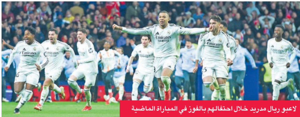
لاعبو ريال مدريد خلال احتفالهم بالفوز في المباراة الماضية

نسبية على فياريال، حيث فاز الريال في مباراة الدور الأول بهدفين نظيفين، كما أنه لم يخسر سوى في مباراة واحدة من آخر خمس مباريات، وتعادل في مباراة.