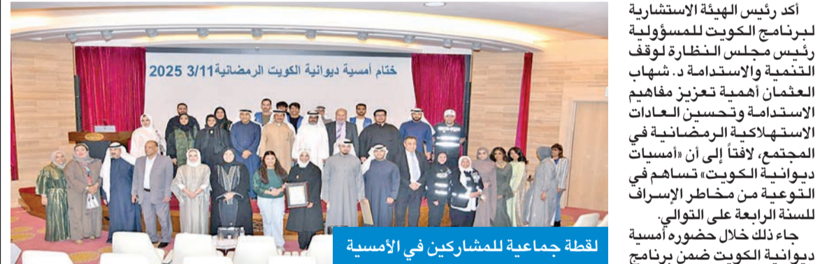
لقطة جماعية للمشاركين في الأمسية

أهداف التنمية المستدامة، يذكر أن الأمسية أقيمت برعاية ماسية من جمعية السلام للعمال الإنسانية والخيرية، والهيئة العامة للشباب، وشركة مطاحن الدقيق والمخابز الكويتية، ومستشفى السلام الدولي، ومستشفى روبال حياة، وفندق كراون بلازا.