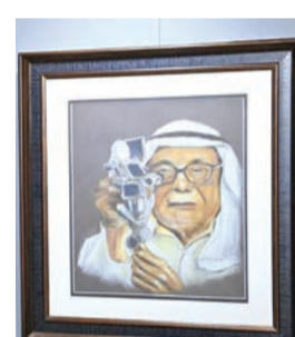
من الأعمال المعروضة

الانقطاع عن المسرح الكويتي، نتيجة ازمتها المتكررة، والهجوم العنيف الذي تعرّضت له في الفترة الماضية بمواقع التواصل، ما دفعها للتفكير في الاستقرار خارج الكويت. وقالت الشعبي، تعقيباً على هذه المشاركة: «أنتقدم بالشكر والعرفان للشخص محمد بن حمد الشرقي حاكم الفجيرة، وولي عهد الفجيرة الشيخ محمد بن حمد الشرقي، على دعمهما لنا، والشكر موصول أيضاً لمدير أكاديمية الفجيرة للفنون الجميلة علي الحيفتي، لتوفير كل الاحتياجات لفريق العمل».