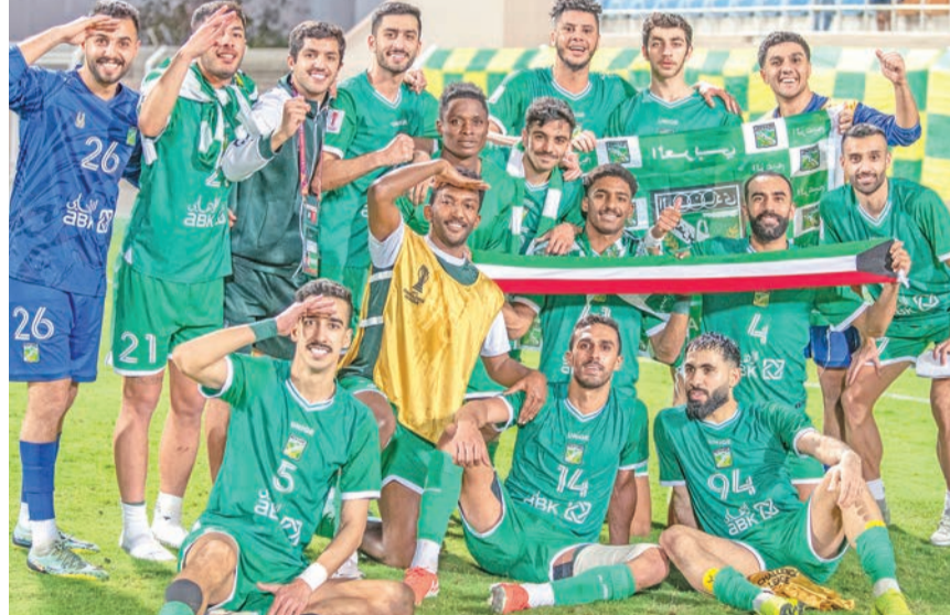
لاعبو العربي يحتفلون بالفوز على السيب العماني