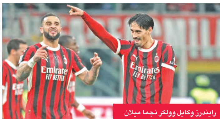
رايندرز وكايل ولكر نجما ميلان

سيئة شهدت تراجع نتائج الفريق في مختلف البطولات، الأمر الذي وضع العديد من الشكوك وعلامات الاستفهام حول المدرب الإسباني.