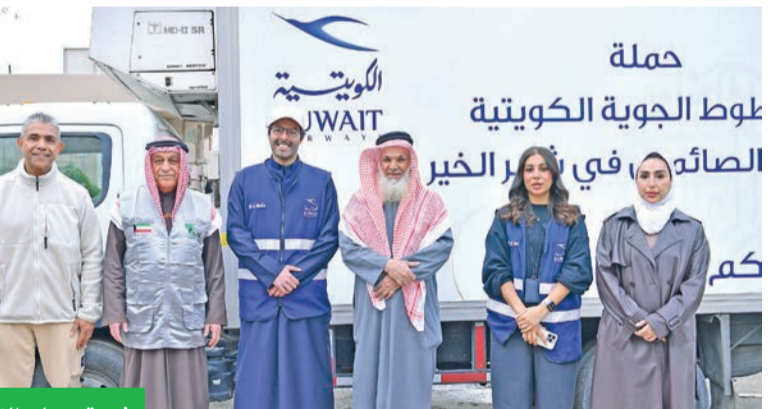
فريق عمل «الكويتية»

ضمن مساعيها الدؤوبة لتطبيق برامجها للمسؤولية الاجتماعية، وفي إطار جهودها الرامية لتعزيز قيم التكافل والتراحم خلال شهر رمضان، أطلقت شركة الخطوط الجوية الكويتية حملتها السنوية لإفطار الصائم، حيث قامت بتوزيع وجبات الإفطار في عدد من المساجد المنتشرة بمختلف محافظات الدولة. وبهذا الصدد، أكدت «الكويتية» أن مبادرة إفطار الصائم التي تطلقها سنوياً تأتي ضمن جهودها لدعم