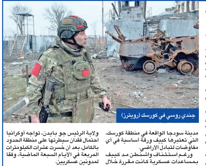
جندي روسي في كورسك

مدينة سوجدا الواقعة في منطقة كورسك، التي تعتبرها كييف ورقة أساسية في أي مفاوضات لتبادل الأراضي. ورغم استئناف واشنطن مد كييف بمساعدات عسكرية كانت مقررة خلال