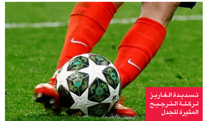
تسديدة ألقاريز لركلة الترجيح المثيرة للجدل

وصرح سيميوني: «قال الحكم إن خوليان لمس الكرة بقدمه الثابتة عندما نفذ الركلة، لكن الكرة لم تتحرك، مضيفاً: «لكن بعيداً عن ذلك الذي لا يخدم الآن سوى الجدل حول ما إذا