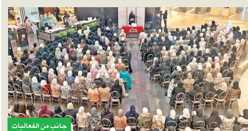
جانب من الفعاليات

فرصة فريدة من نوعها للتفاعل والتعلم. وفي مسعى لتعزيز الصحة العامة، أطلقت «الحمراء» مبادرة التحفيز على الرياضة تحت اسم «Al-Hamra In Motion»، والتي تقام كل عام بهدف تشجيع زوار ورواد «الحمراء» على ممارسة النشاط البدني خلال هذا الموسم المبارك، وتستمر حتى 20 مارس، وتتضمن برنامجاً صحياً بالشراكة مع تطبيق Burn، على مجموعة متنوعة من أنشطة اللياقة البدنية؛ مثل: