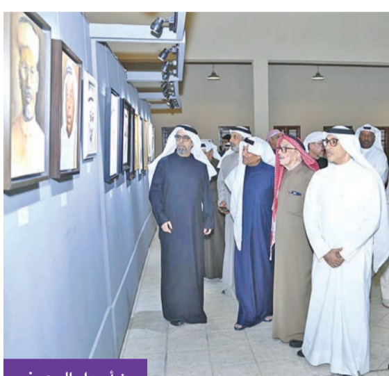
من أجواء المعرض

من جهته، قال ميرزا إنه بدأ التحضير للمعرض منذ حوالي 5 سنوات، واستثمر فترة جاححة