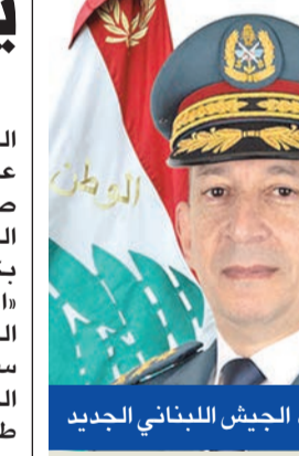
قائد الجيش اللبناني الجديد

أقر مجلس الوزراء اللبناني التعيينات العسكرية والأمنية، في خطوة ضرورية لانظام عمل المؤسسات بعد أزمة سياسية خلفت فراغاً لأكثر من عامين في منصب رئيس الجمهورية. وقال وزير الإعلام بول مرقص، إن جلسة مجلس الوزراء التي عقدت أمس برئاسة رئيس الجمهورية جوزيف عون، أقرت التعيينات العسكرية والأمنية، حيث عين العميد رودلف هيكل قائداً للجيش، والعميد راشد عبد الله مديراً عاماً لقوى الأمن الداخلي، والعميد حسن شقير مديراً عاماً للأمن العام، والعميد ادغار لاوندرس مديراً عاماً لجهاز أمن الدولة. وتولى هيكل منصب قائد عمليات الجيش وقائد منطقة جنوب الليطاني، وهو على علاقة جيدة بواشنطن وقوات «يونيفيل»، ومحسوب على رئيس الجمهورية.