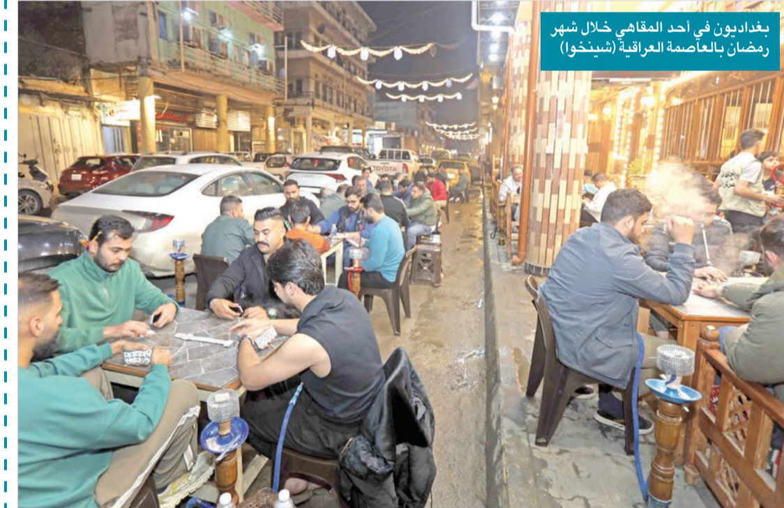
بغداديون في أحد المقاهي خلال شهر رمضان بالعاصمة العراقية (سنيخوا)

* الأمين العام للمنبر الديمقراطي الكويتي