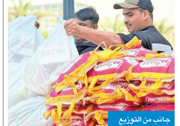
جانب من التوزيع

في مبادرة رمضانية، ورع قسم الأنشطة التطوعية والجمالية في جامعة الكويت الطلبة بجامعة الكويت، أمس الأول، 300 سلة غذائية على العاملين بالجامعة، بالتعاون مع البنك الكويتي للطعام والإغاثة، وذلك بجانب مبنى المركز الثقافي في الشادية، وتأتي هذه المبادرة انطلاقاً من رسالة الجامعة في تعزيز قيم العطاء والتكافل الاجتماعي.