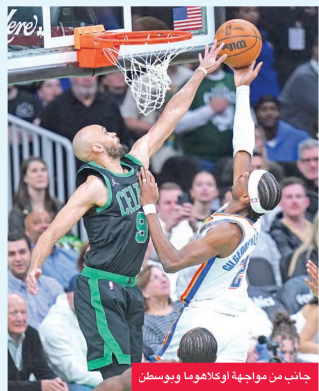
جانب من مواجهة أوكلاهوما وبوسطن

قاد النجم الكندي لأوكلاهوما سيتي ثاندر، شاي غلجيوس-الكسندر فريقه إلى «بلاي أوف» بإسقاط ضيفه بوسطن سلتيكس حامل اللقب 118-112 الأربعاء في دوري كرة السلة الأمريكي للمحترفين (إن بي إيه)، ويفضل نقاط صانع الألعاب الكندي 34، حجز أوكلاهوما مقعده في الأدوار الإقصائية بعد الفوز في مواجهة قد تكون بمنزلة «بروفا» لنهاية الدوري. وواصل غلجيوس-الكسندر تعزيز مكانته كأحد أبرز المرشحين لجائزة أفضل لاعب في الموسم، بعدما قدم أداءاً رائعاً أسكت به جماهير ملعب «تي دي غاردن»، في بوسطن ضمن مباراة حُسمت في الربع الأخير.