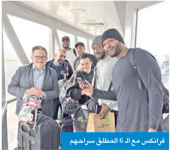
فرانكس مع الـ 6 المطلق سراحهم

فرانكس: لفتة إنسانية... ومن المتوقع إطلاق أميركيين آخرين قريباً