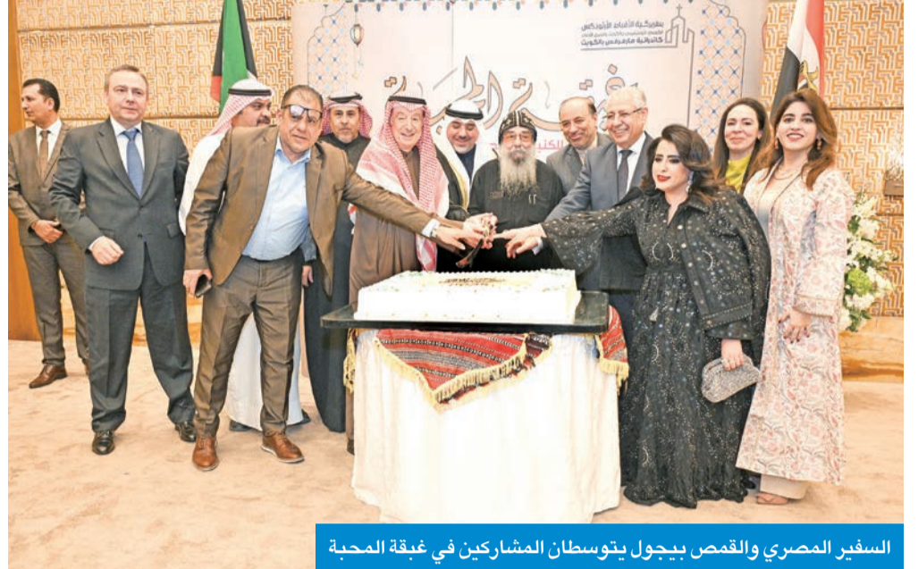
السفير المصري والقمص بيجول يتوسطان المشاركين في غبقة المحبة

أقامت الكنيسة المصرية غبقتها الرضمانية جرياً على عاداتها السنوية، بحضور عدد لافت من أطراف المجتمع الكويتي، وسط أجواء سادتها الألفة والمحبة. وقال السفير المصري لدى البلاد، أسامة شلتوت، في كلمة له خلال الحفل: «عاماً تلو الأخر، وكعادة الكنيسة المصرية تجتمع مسلمي مصر وأقباطها مع أشقائهم من الكويت لنحتفل معاً بصيامنا، ولنتبرز وحدة الشعب المصري وروح الأمة الواحدة في (غبقة المحبة) التي باتت تقليداً مقدراً من تقاليد الكنيسة المصرية بالكويت في تعزيز التلاحم