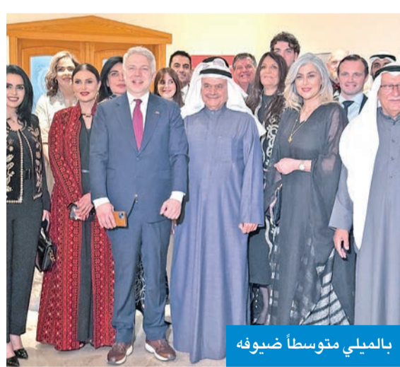
بالميلي متوسطاً ضيوفه

«علاقاتنا بأفضل حالاتها... ونقترب من مذكرة تفاهم لتعزيز الجهود الإنسانية والتنموية»