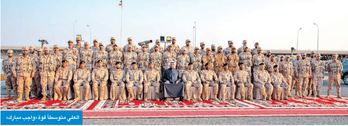
العلي متوسطاً قوة «واجب مبارك»

زار قوة «واجب مبارك» بالمنطقة الشمالية ودعا لمواصلة العطاء لخدمة الوطن