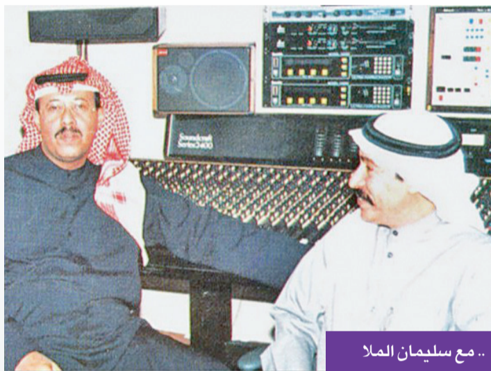
.. مع سليمان الملا

نظراً للمكانة التي تبوأها الفنان عبدالكريم عبدالقادر، اختير ضمن مشروع أشهر مئة في الغناء العربي للباحث المصري محمد سعيد، ويعد من أهم المشاريع التي تؤرخ للأغنية العربية. يصنف الباحث الفنان عبدالقادر بأنه من أهم مطربي الكويت، وهو صاحب تاريخ فني ممتد، قدم العديد من الأعمال الناجحة والمميّزة التي عبرت عن هموم أمته، ومنها أغنية «وطن النهار».