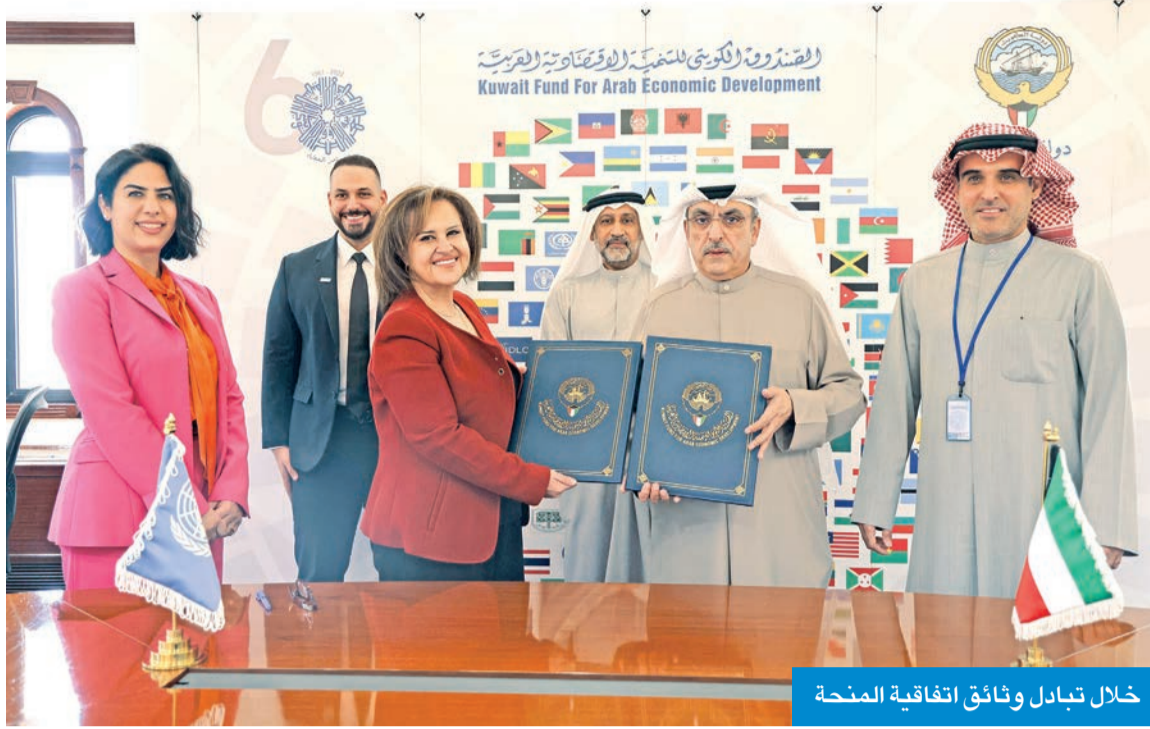
خلال تبادل وثائق اتفاقية المنحة

البحر: ملتزمون بالوقوف إلى جانب الشعب اليمني في أزمته الكارثية