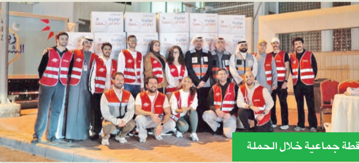
لقطة جماعية خلال الحملة

البنك بإهداء المأجلة لرواد لولو هايبير مدى ستين عاماً، كان خلالها جزءاً لا يتجزأ من تاريخ الكويت الاقتصادي والاجتماعي. يُذكر أن حملة بنك الخليج (عوايدنا) دوم جمعنا) تتضمن توزيع المأجلة الرمضانية على مدى أربعة أيام، بالتعاون مع البنك الكويتي للطعام وسيتي هايبير ماركت، إلى جانب مشاركته في فعالية «أرض المرح» التي تم خلالها توزيع المستلزمات المنزلية وكسوة العيد للأسر، إضافة إلى المأجلة الرمضانية. كما قام