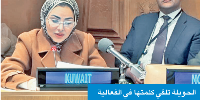
الحويلة تلقي كلمتها في الفعالية

شاركت بفعالية «المرأة العربية نحو الإبداع والابتكار في عصر الثورة الصناعية»