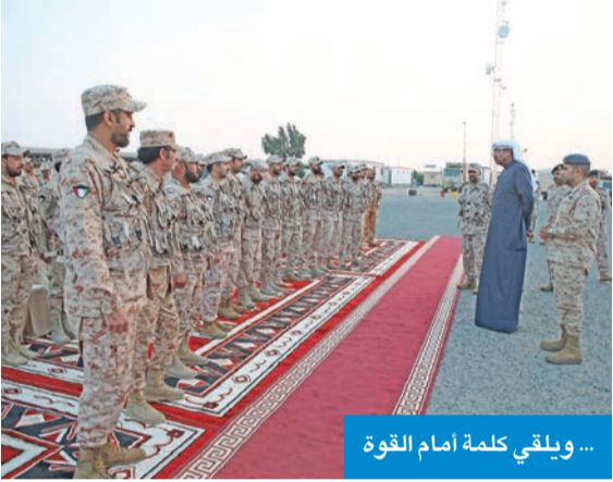
... ويلقي كلمة أمام القوة

الخالد بمناسبة حلول شهر رمضان المبارك وأعرب العلي، في كلمته، عن سعادته بوجوده بين إخوانه وأبنائه العسكريين، ودعا منتسبي القوة البرية إلى مواصلة البذل والعطاء لخدمة الوطن، سائلاً الله العلي القدير أن يديم نعمة الأمن والأمان على الكويت، وأن يعيد شهر رمضان المبارك على البلاد وأهلها بالخير واليمن والبركات، في ظل القيادة الحكيمة لسمو أمير البلاد القائد الأعلى للقوات المسلحة وسمو ولي العهد.