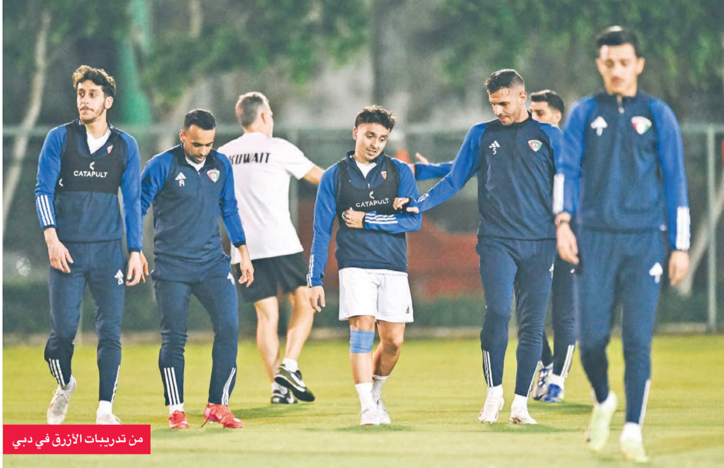
من تدريبات الأزرق في دبي

غياب الدورات الرمضانية في الكويت يمثل خسارة كبيرة، ليس فقط من ناحية المتعة والترفيه، ولكن أيضاً في دعم وتطوير الرياضة والشباب، ومن المهم أن تتحمل الجهات الحكومية مسؤولية تنظيم مثل هذه الفعاليات التي تعود بالفائدة على الجميع، وتساهم في تنمية المجتمع واكتشاف المواهب الرياضية المدفونة، التي ربما لن تجد فرصة للتعبير عن نفسها إلا من خلال هذه الفعاليات، مما يساعد في تطوير الرياضة على كل الصعد.