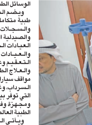
وزير الصحة خلال الزيارة