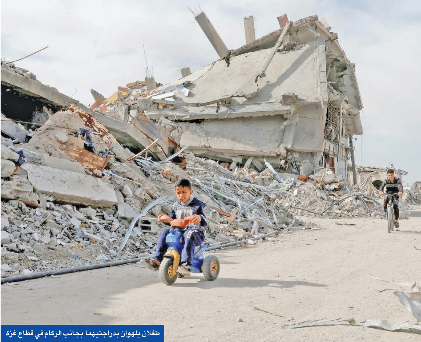
طفلان يلهوان بدراجتيهما بجانب الركام في قطاع غزة

المتحدة على أنها إبادة جماعية، مشيراً إلى أنها «تقترب عمداً بطرف حياثية للمجموعة (أي الفلسطينيين) محسوبة للتسبب بتدميرها بدنياً» وتفرض إجراءات تهدف إلى منع حدوث ولادات ضمن المجموعة. ودانست الأمم المتحدة الاحتجاز التعسفي الواسع النطاق للفلسطينيين، ومنهم الأطفال، والاستخدام الممنهج للتعذيب في «مراكز الاحتجاز الإسرائيلية» منددين بالتهجير القسري الجماعي في غزة والضفة. ومع تمسك الاحتلال بمنع المساعدات إلى غزة، أعلنت محكمة العدل الدولية أنها ستعقد جلسات استماع الشهر المقبل للنظر في التزامات إسرائيل الإنسانية تجاه الفلسطينيين.